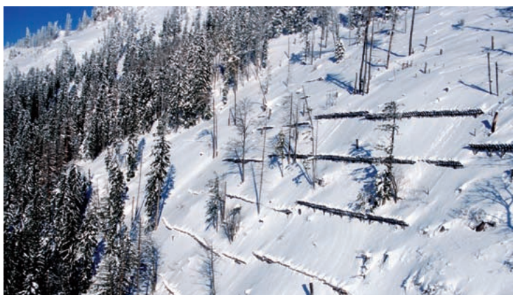
Sch'in gaud da protecziun efficazi manca, èsi necessari da construir rempars tecnics chars. Protecziun cunter lavinias al Bläserberg SG.