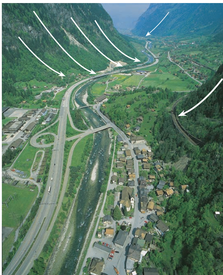
Gaud da protecziun cunter privels da la natira al Gottard

L'effect da protecziun dal gaud è perquai ina basa impurtanta per noss aut standard da viver.