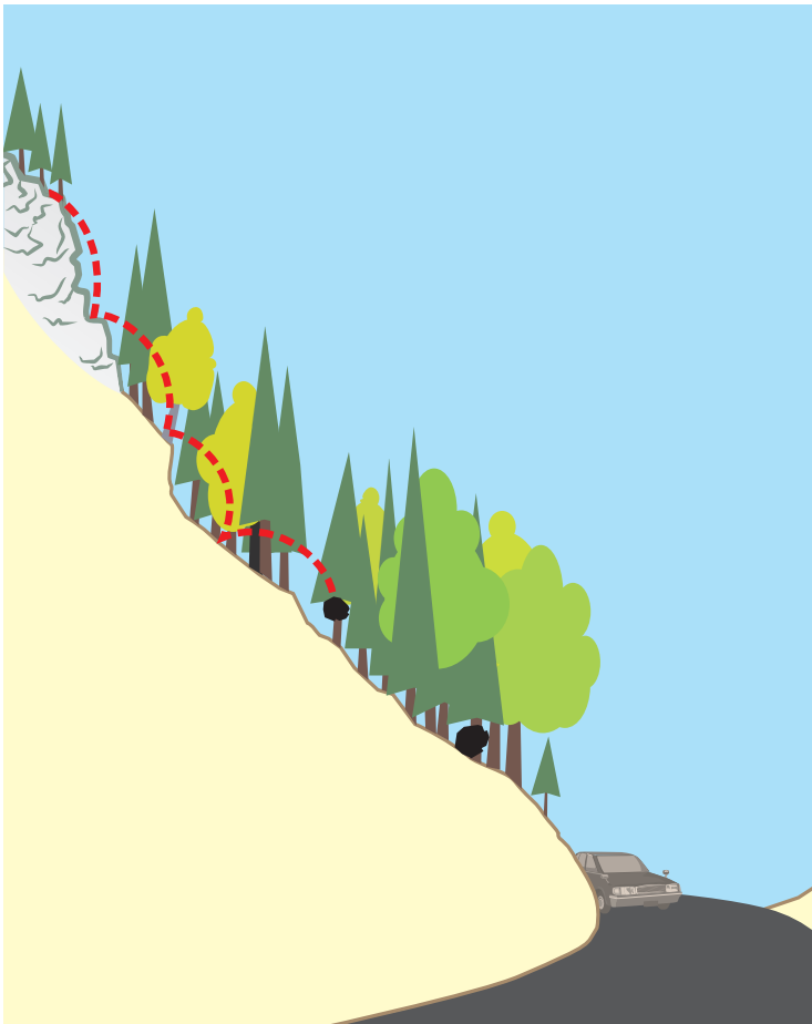
Il gaud protegia las axas da transit cunter crudada da crappa (grafica: A. Brun)