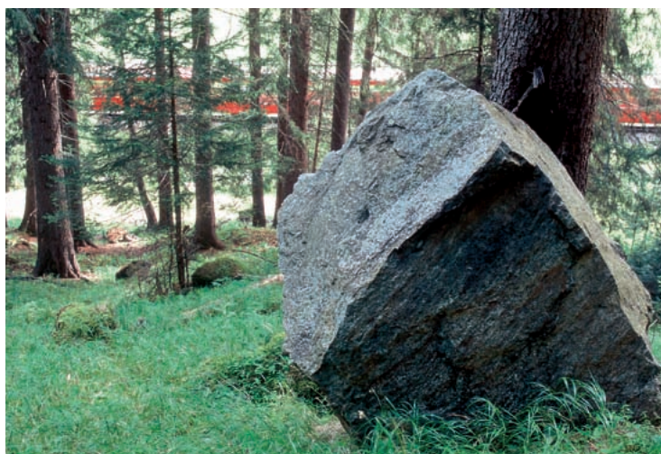
In gaud tgirà retegna crudada da crappa