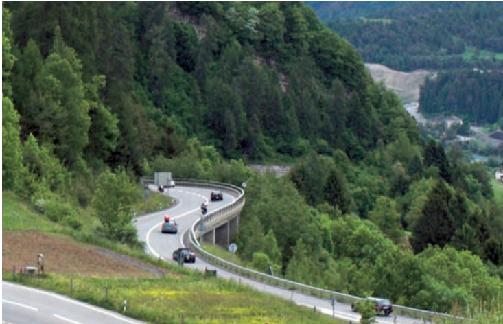
Per ir en vacanzas en il sid maina la via tras ils gauds da protecziun da las Alps