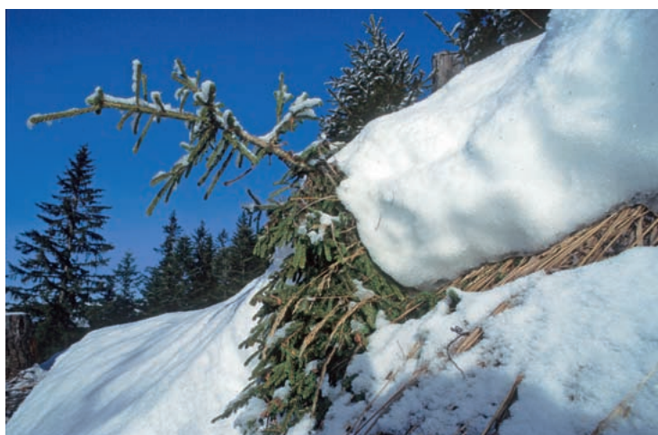
Plantas stabilas impedeschan che lavinas sa distagian