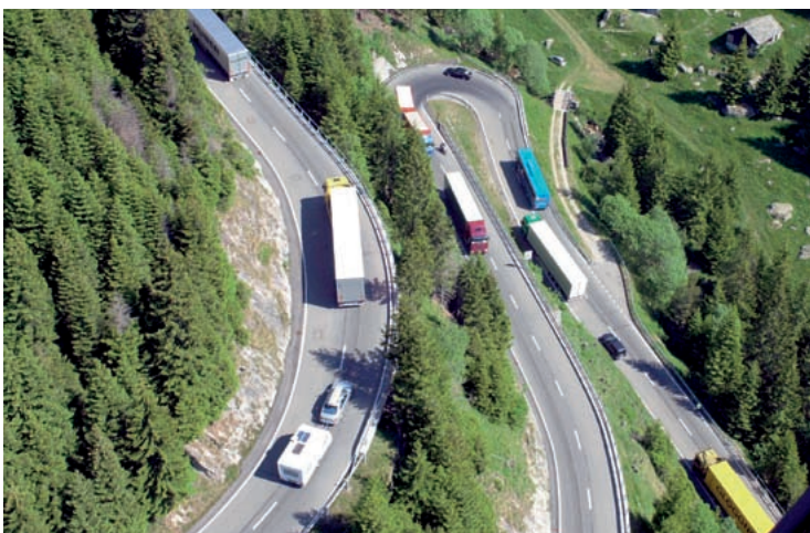
Transport da rauba segir sur las Alps