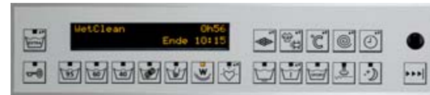
Adora SLQ, Blende ist auch im Standard-Design (Anthrazit) erhältlich

Ein Blick auf die gut ablesbaren Anzeigen auf dem InfoScreen – und Sie wissen immer, was gerade läuft und was zu tun ist. So kommen Sie einfach und mühelos durch den Waschprozess. Dank vollgrafischen Funktionen kann der InfoScreen ausser Text auch schnell verständliche Piktogramme zeigen. Ganz nach dem Motto: Ein Bild sagt mehr als tausend Worte. Versteht sich, dass ein solches Informationsgenie auch mehrsprachig ist, n'est-ce pas?