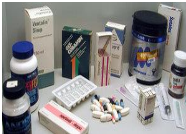
Preparats u medicaments che cuntengnan substanzas nunlubidas – pia doping