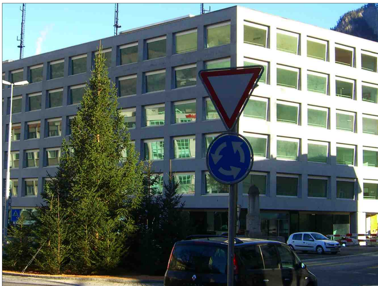
Chasa RTR a Cuir.