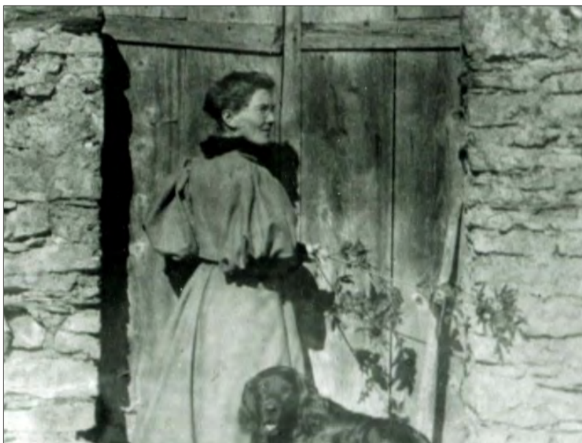
Meta von Salis-Marschlins (1855–1929).