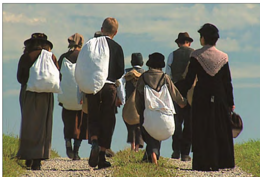
Singuls films cuntegnan scenas giugadas (docudrama).