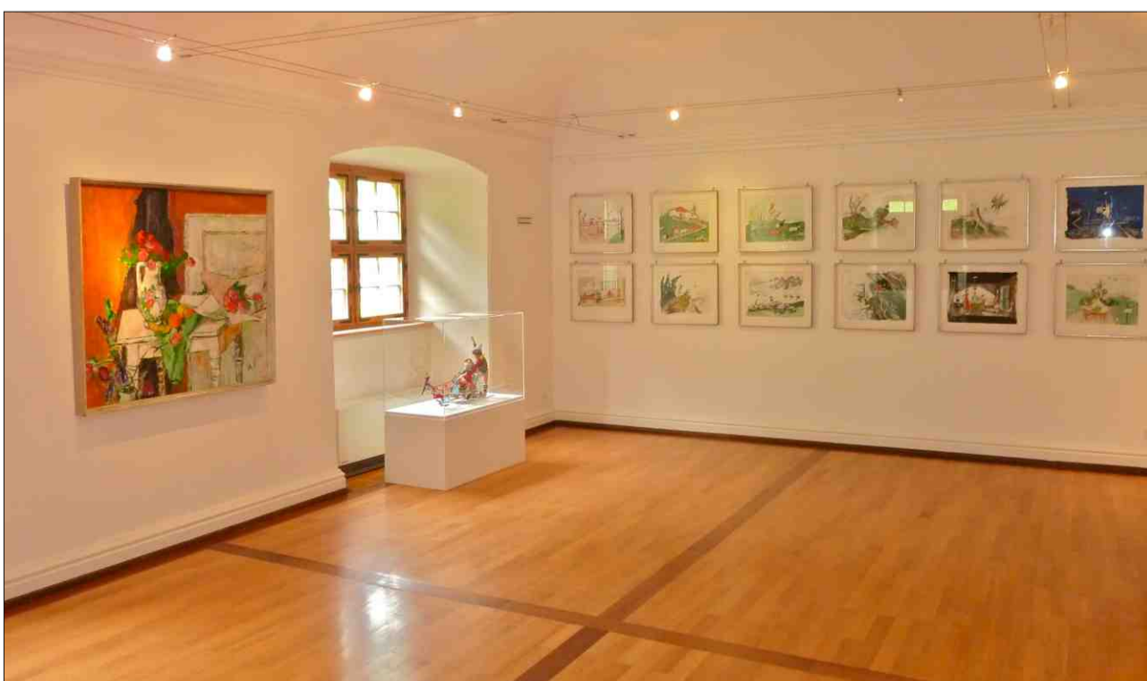
Exposiziun dad Alois Carigiet a Trun.