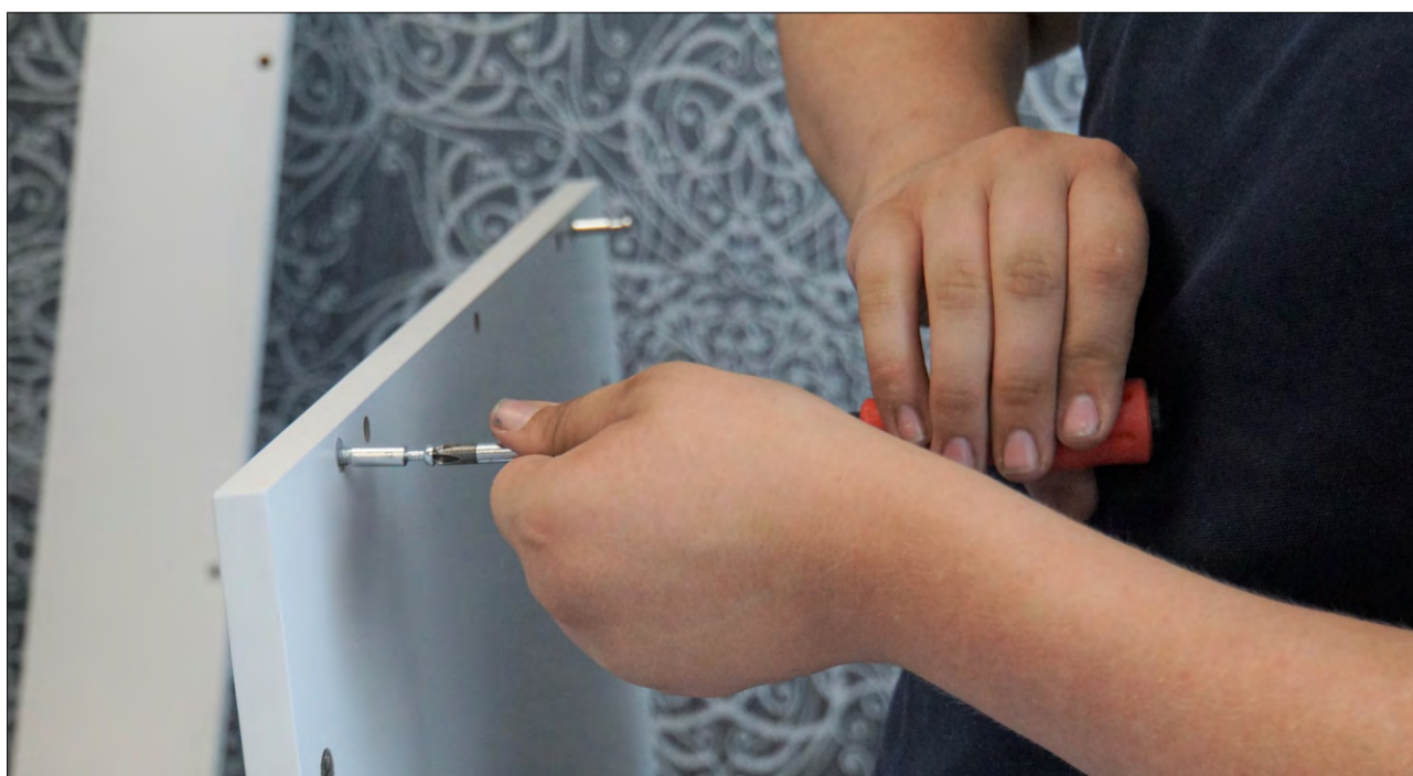
Onns da giuventetgna – il lung process vers l'atgna independenza.