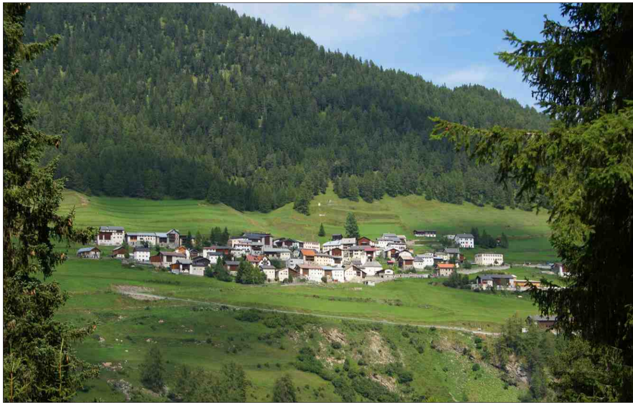
Vnà en l'Engiadina Bassa.

Il 1992 è Lü vegnì enconuscent sin plaun nazional: tut ils 39 votants e vo-