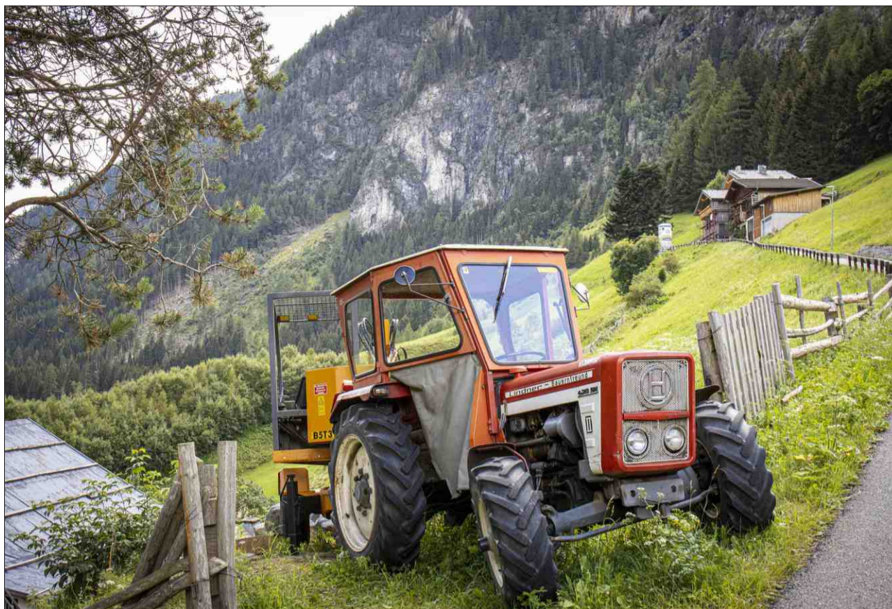
In mund cun in ritums tut agen: l'agricultura en il territori alpin.

L'onn 2000 ha l'autur Gieri Venzin detgà in da ses numerus films documentars a la vatga da las vatgas, la brina! La vatga preferida en il Grischun, anzi en l'entira Svizra e sur ses cunfins or. La vatga brina accumplecha fidaivlamain tut sias obligaziuns. Ella dat nà per nus latg e charn, pel ed ossa, e quai dapi 100 onns. Ma la vatga brina ha fatg atras in svilup enorm e cun ella er il puresser. Buna puscha, chara puscha, ma er povra puscha! («Sas anc?», emissiun dals 5 da fanadur 2015; redacziun: Gieri Venzin).