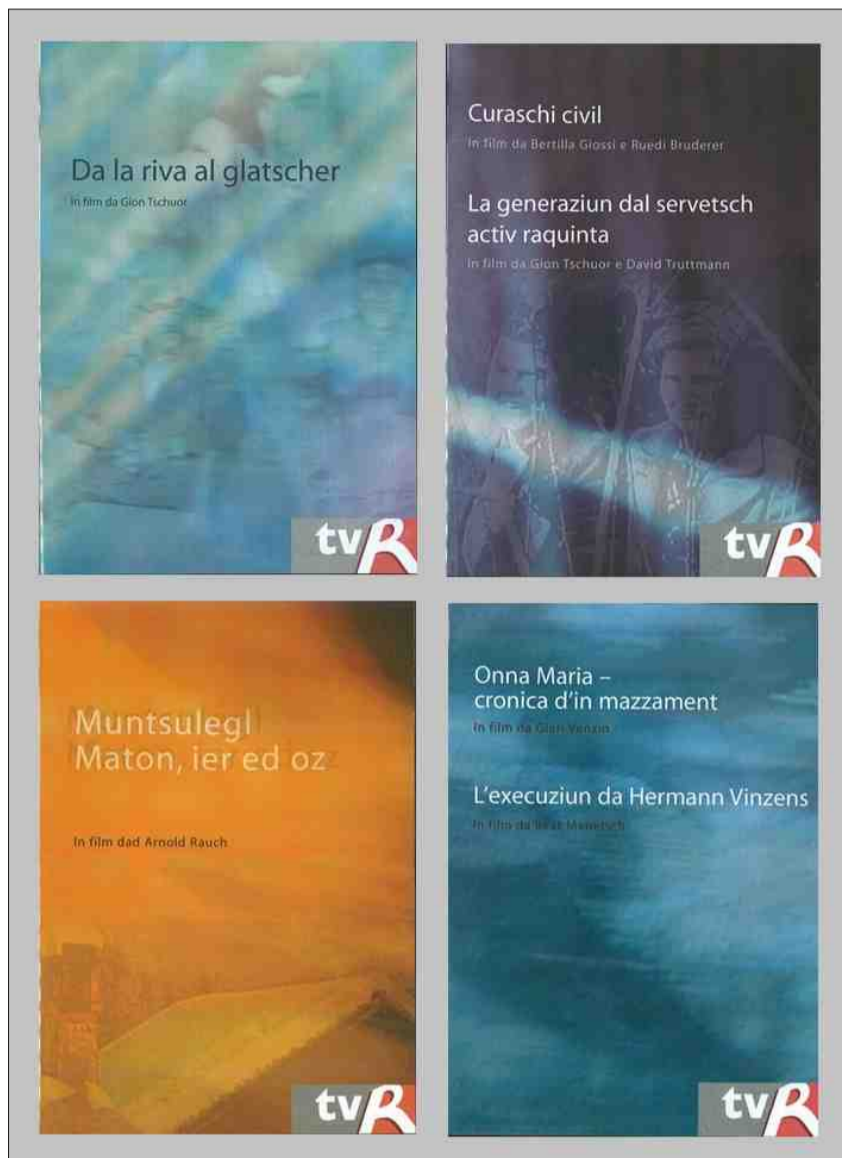
Per part èn plirs films da sumeglianta tematica cumparids ensemen sin in DVD.

En il rom da sias activitads en las regiuns organischa RTR regularmain sairadas «da CUMPAGNIA». Ina tala è stada ils 23 da favrer 2008 a Trin. Entaifer il program da chant e musica cun ils chors da Trin (chor maschadà, chor viril, chor da scolarAs), la Brass band ed auters pli ha la Televisiun Rumantscha mussà ina retscha da films producids durant ils onns; films che documenteschan vita, lavur e svilup en la vischnanca da Trin. Cuntegn: Persunas, Natira ed ambient, Chant e musica, Sviament. (2008).