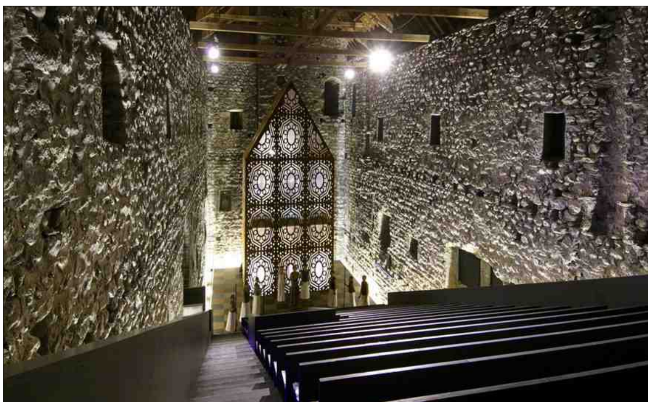
Inscenaziun dad Origen en il chastè da Riom.