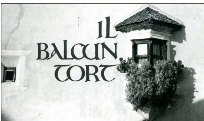
Cumparsa da l'emissiun «Il Balcun Tort».