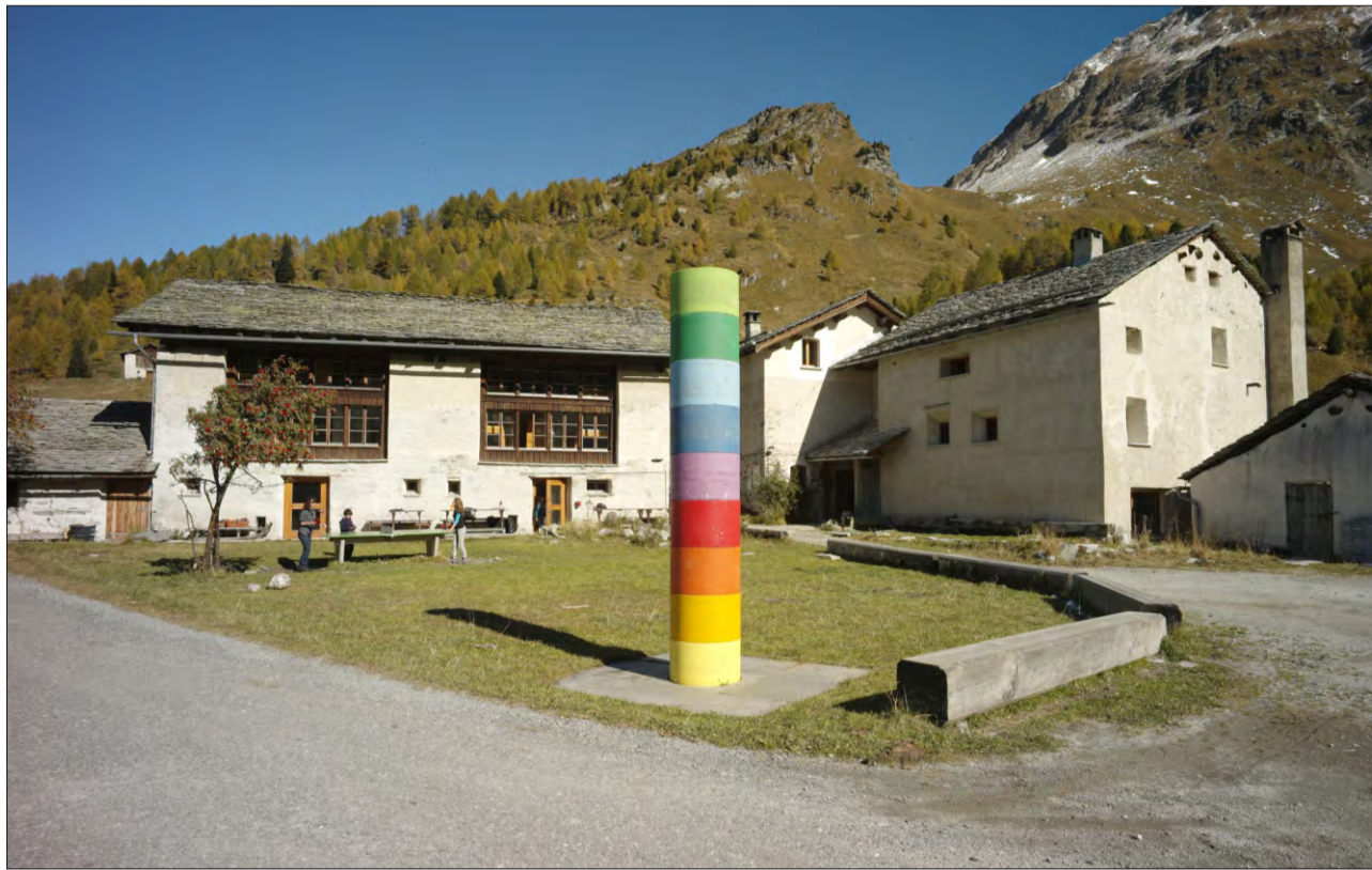
Impressiun da Salecina l'onn 2009.

A chasa sa rimnan ina u l'autra chaussa ch'ins ha iertà, rimnà u survegnì. Chaussas ch'èn forsà si surchombras ed èn prest emblidadas u forsà er chaussas che fan bella parita en stiva. Forsa èn questas chaussas schizunt preziasadads ed ins gnanc na sa quai. Il matg 2013 ha il Museum Regiunal Surselva a Glion dà la pussaivladad da laschar stimar quests objects. Expertas ed experts han guardà ils objects ed han ditg sche quels hajan