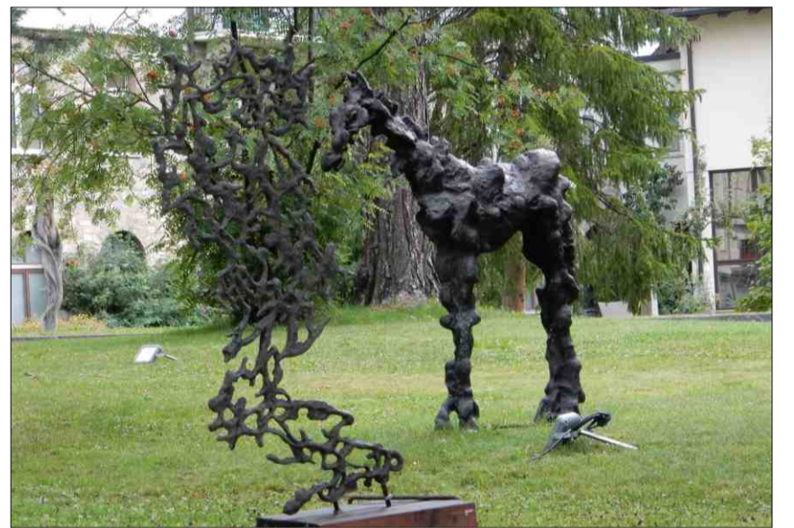
Plasticas da Giuliano Pedretti.

adina fitg activ: in um grond ed in grond um! (Emissiun dals 29 da matg 2011, redacziun: Arnold Rauch).