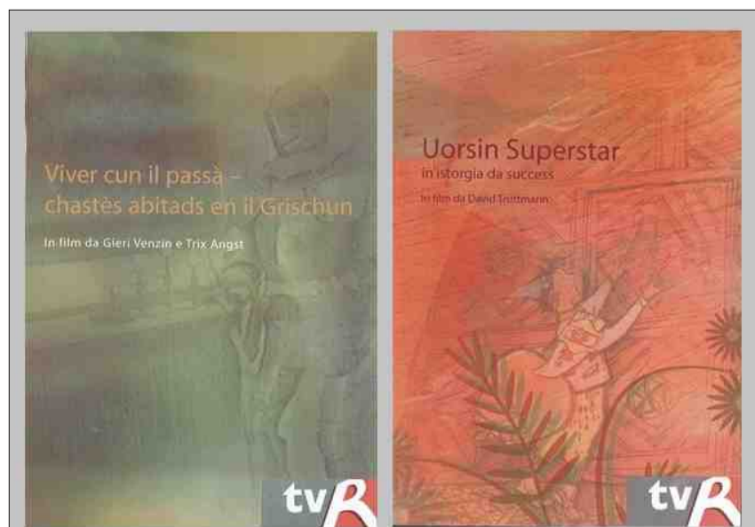
Uschia sa preschentan las cuvertas dals DVD.