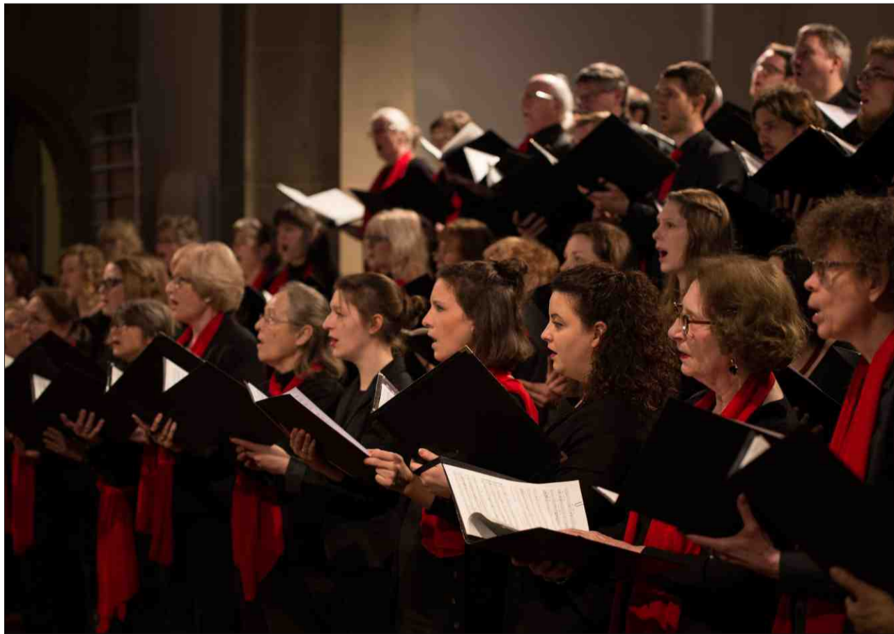
Il chant choral – in'impurtanta pitga da la cultura rumantscha (foto simbolica).

Ina chanzun, trais chors e 200 umens. A la Festa svizra da chant a Meiringen dattan ils trais gronds chors virils communablamain in concert festiv. Il film «Total viril» raquinta da la passiu per il chant viril, da l'istorgia gloriosa dals trais chors, da lur impurtanza politica e da lur