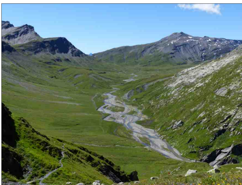
La Greina entadim la Val Sumvitg.