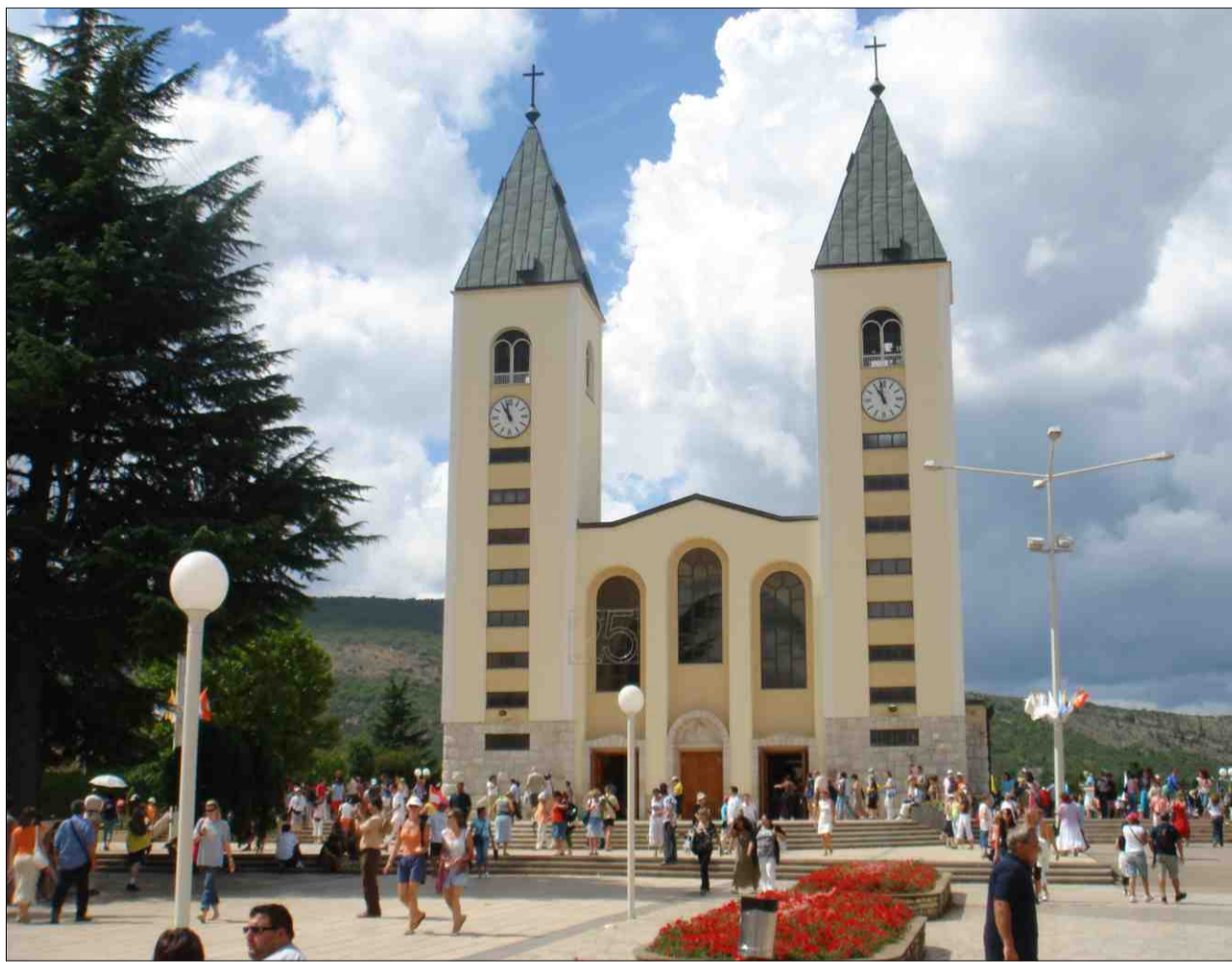
Baselgia da peleginadi a Medjugorje.