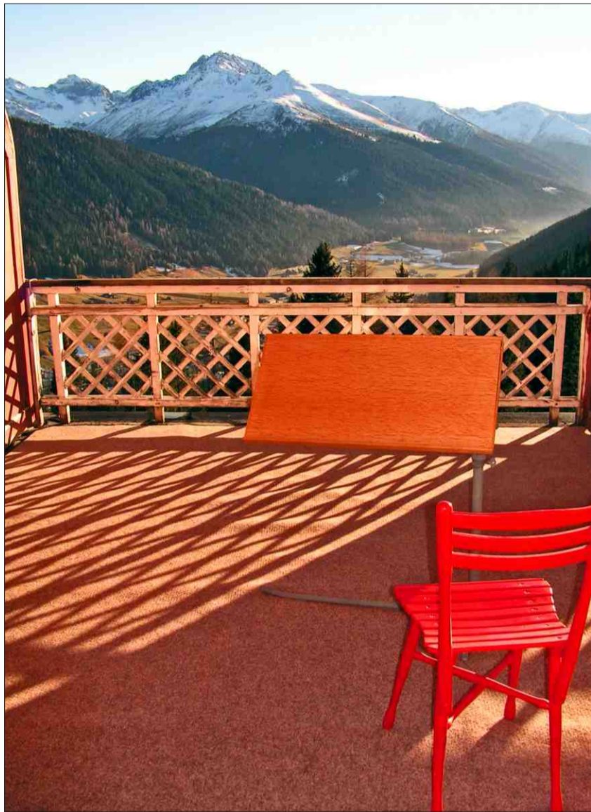
Hotel Schatzalp, Tavau.

L'entschatta dal 20avel tschientaner è stà