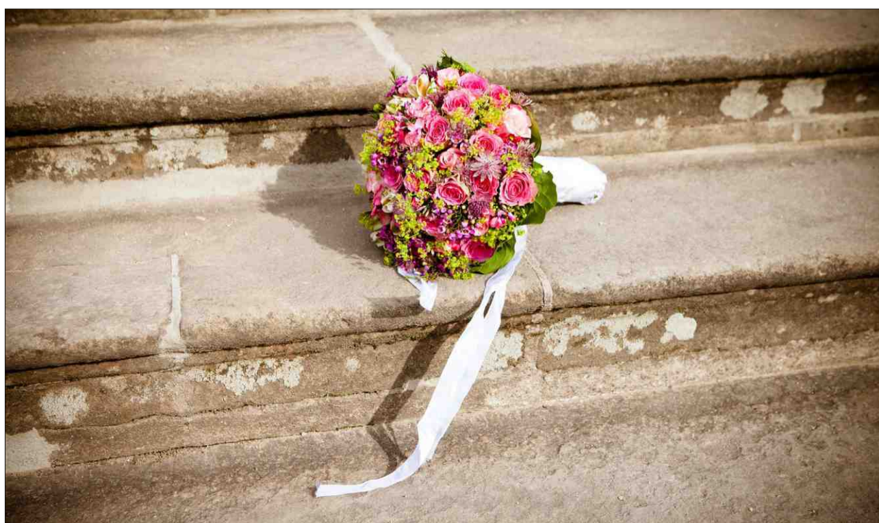
Impressiun da nozzas.