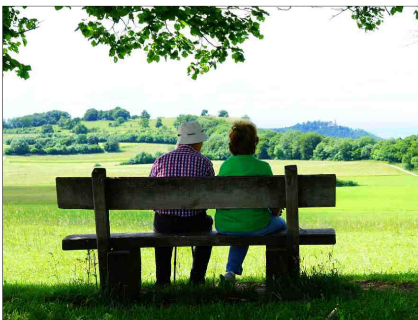
«Esser vegl e cuntent vul dir, restar uschè ditg sco pussaivel independent.»