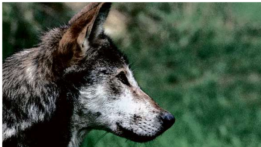
La lescha è refusada – pero ils quitads dals purs cul luf èn adina anc qua.

Tenor la versiun da l'iniziativa parlamentara duai la nova lescha cuntengnair almain trais aspects: Primo «ina regulaziun pragmatica dals lufs cun rinforzar las mesiras da protecziun da las muntaneras sco era ulteriuras mesiras per la convivenza tranter luf ed uman». Secondo «ina protecziun effizienta da speziis d'animals periclitads» e terzo «in rinforzament da la biodiversità, principalmain en connex cun corridors d'animals selvadis e territoris da protecziun».