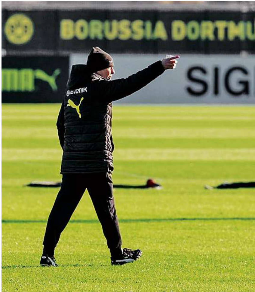
«Je n'ai jamais tenu de propos malveillants envers le romanche.» – Lucien Favre durant in trenament public da Borussia Dortmund.

Insumma, diligentamain hai jau adina legì las intervistas cun Lucien Favre en gasettas tudestgas u franzosas. Uschia hai jau era legì ils 7 da matg 2008 – durant il temp che Favre era trenader tar Hertha BSC da Berlin – in'intervista en il Tagesspiegel. L'intervistader ha dumandà diversas chaussas sur da la Svizra, tranter auter er davart la lingua rumantscha. La dumonda: «Rätoromanisch, die vierte Landessprache, spielt offensichtlich keine