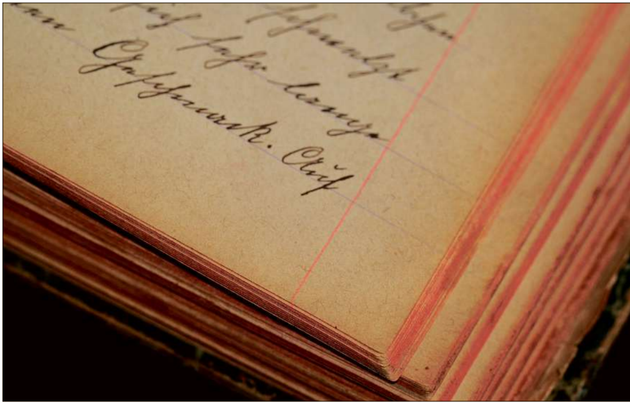
Fin ils onns 1880/90 è la lavur da biro stada segnada da la penna da scriver.

Suenter la fundaziun da la Confederaziun l'atun 1848 metta la citad da Berna a disposiziun ils emprims plazs da lavur probablmain gia endrizzads per la Confederaziun. I sa tracta da locals da lavur per ils emprims set cussegliers federals e l'emprim chancelier federal sco er plazs da lavur per il stab da l'administraziun ch'è al cumenzament anc pulit pitschen. Ils emprims locals da lavur che vegnan erigids aposta per l'administraziun federala vegnan construids cun la chasa dal Cussegl federal, oz la Chasa federala vest, nua ch'i vegn lavurà dapi il 1857. La citad da Berna construescha la chasa ed il Cussegl federal surpiglia tenor il protocol da collaudaziun il mobigliar. Davart l'endrizzament da questa chasa dal Cussegl federal cun sias salas per il Cussegl nazional ed il Cussegl dals chantuns sco er da las stanzas per il Cussegl federal e la finla las stanzas per ils singuls schefs dals departaments e lur administraziun savain nus mo pauc. 84 emploiads d'administraziun cumenzan a lavurar en la chasa –