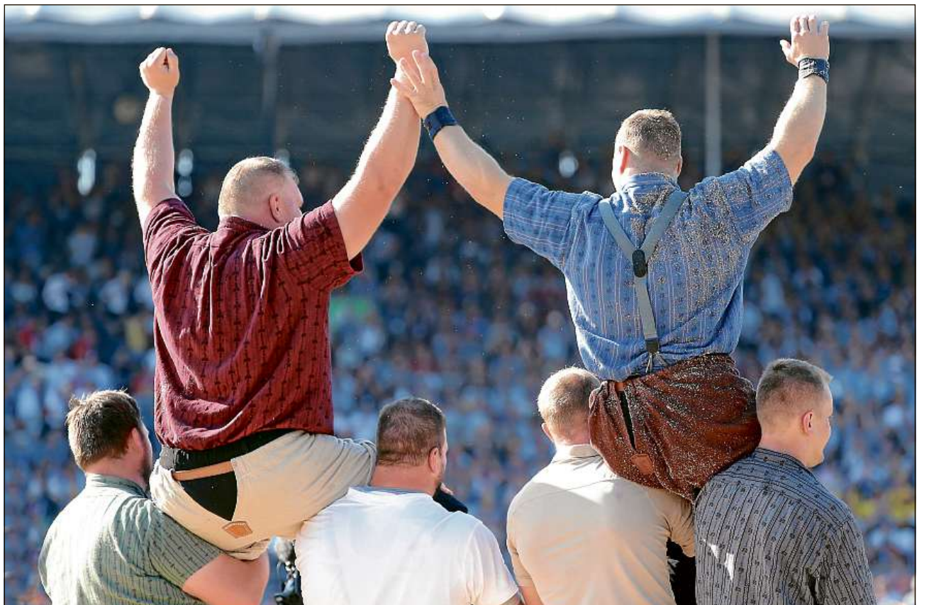
Omadus coloss, ils finalists-lutgadurs.

L'antierur lutgatur e bandierel da la Federaziun grischuna da lutga ha ditg che da ses temp eria la concorrenza per in pau pli pitschna. Oz haja mintga federaziun en ses cader ina gronda paletta da lutgadurs da la classa superiura. In lutgatur che possa ir a la Festa federala da lutga, quel tutgia tar in dals fermes en sia federaziun, manegia Pazeller. Er a Zug haja quai sa verifitgà cun ina rotscha lutgadurs senza cranz federal mussar prestaziuns da vaglia.