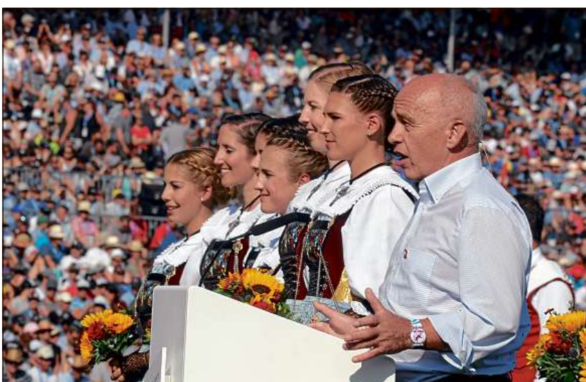
Cusseglier federal Ueli Maurer ha tegni il pled da festa.