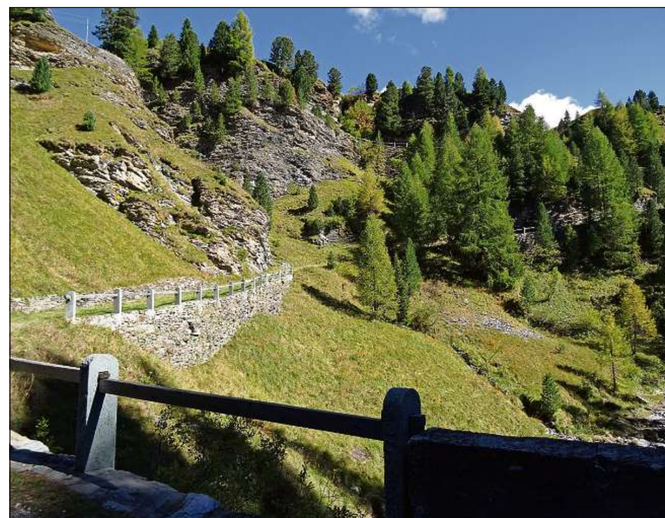
Qua maina la via atras Furra. Prest arrivan ins ad Avras Cresta.