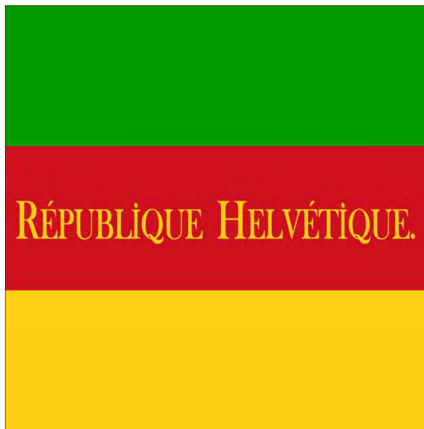
Bandiera da la Republica helvetica.

La bandiera dal battagliaun Hettlinger: 1802. Autezza 174 cm, larghezza 174 cm. Bandiera cotschnenta da saida bain mantegnida cun ina crusch alva. Tschupè da feglia da ruver ed inscripziun: «Division d'Auf der Maur. Battalion Hettlinger. Sieg. Im und. Vorwärts. Pfauenholtz.» Da la Battaglia da Faoug, l'uschenumnà «Stecklikrieg».