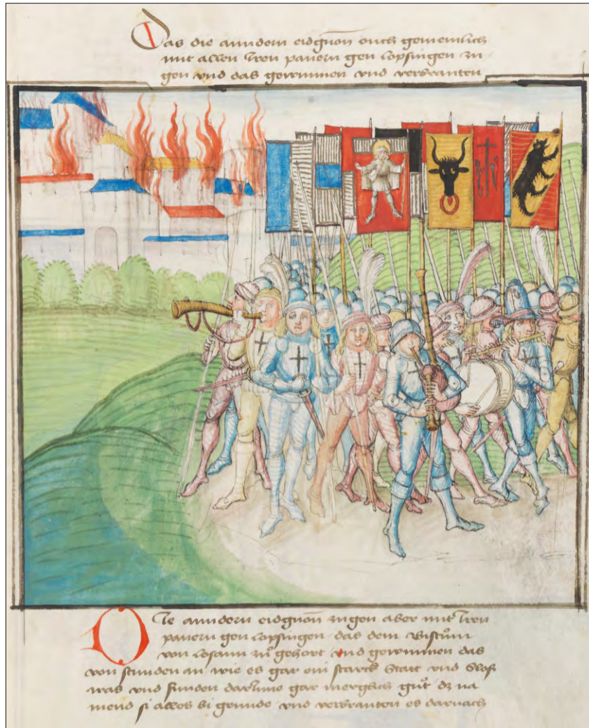
Bandieras dals Confederads a la Battaglia da Nancy (1477).

La bandiera da la Guerra da Burgogna: Bandiera chantunala da la mesadad dal 15avel tschientaner. Rectangulà, verticala. Autezza 159 cm, larghezza 111–112 cm, cumprais la taja. Bandiera bain mantegnida d'in ordvart bel taftà da saida cotschen. La bandiera posseda il pli vegl quader da chantun mantegnì da Sviz, in quader da tgirom cun picturas dal Crucifitgà e dals utensils da la Passiun (Arma Cristi). La furma da la taila permetta da datar la