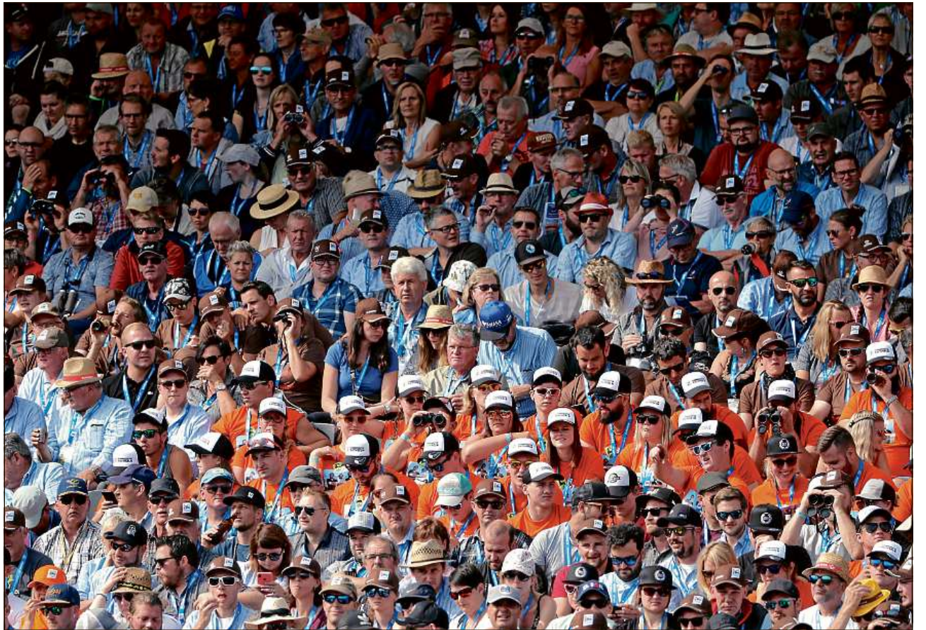
Tribunas plainas en l'arena tar la gronda festa a Zug.