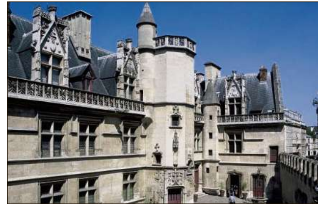
Les Temps mérovingiens al «Musée de Cluny» (Paris). MAD

Gist areguard lez temp scriva l'istoricher Lothar Deplazes (1939–2015): «En consequenza da la suveranità indeblida dals Francs en il 7. (...) tschientaner ha la Currezia cuntanschì ina posiziun autonoma a l'ur da l'imperi» (5). Ils Merovingis eran tuttina vegnids adaquella da dominar l'entir territori svizzer d'oz, danor