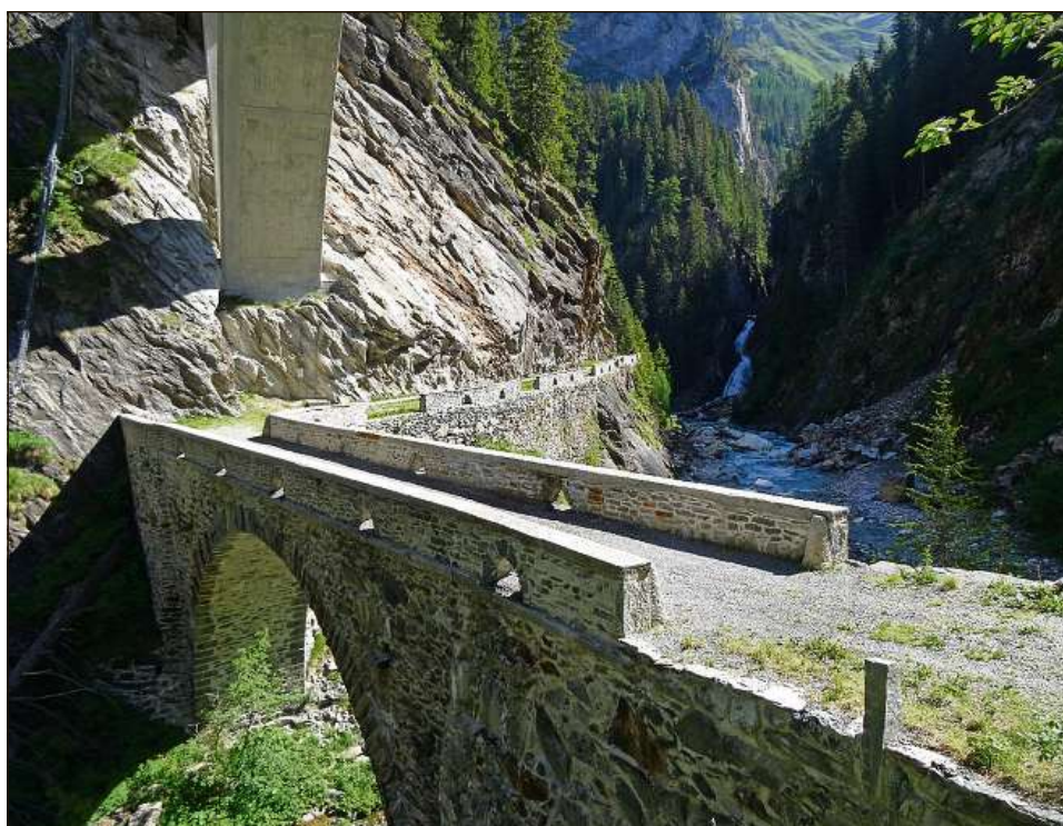
La veglia via dad Avras maina sur la punt da l'aua che sburfla ord la Valle di Lei.

Per la spassegiada en Val d'Avras e Madris pon ins s'annunziar tar hugentobler_forsting.eth@bluewin.ch . Dapli infurmaziuns chattan ins sin fls-fsp.ch .