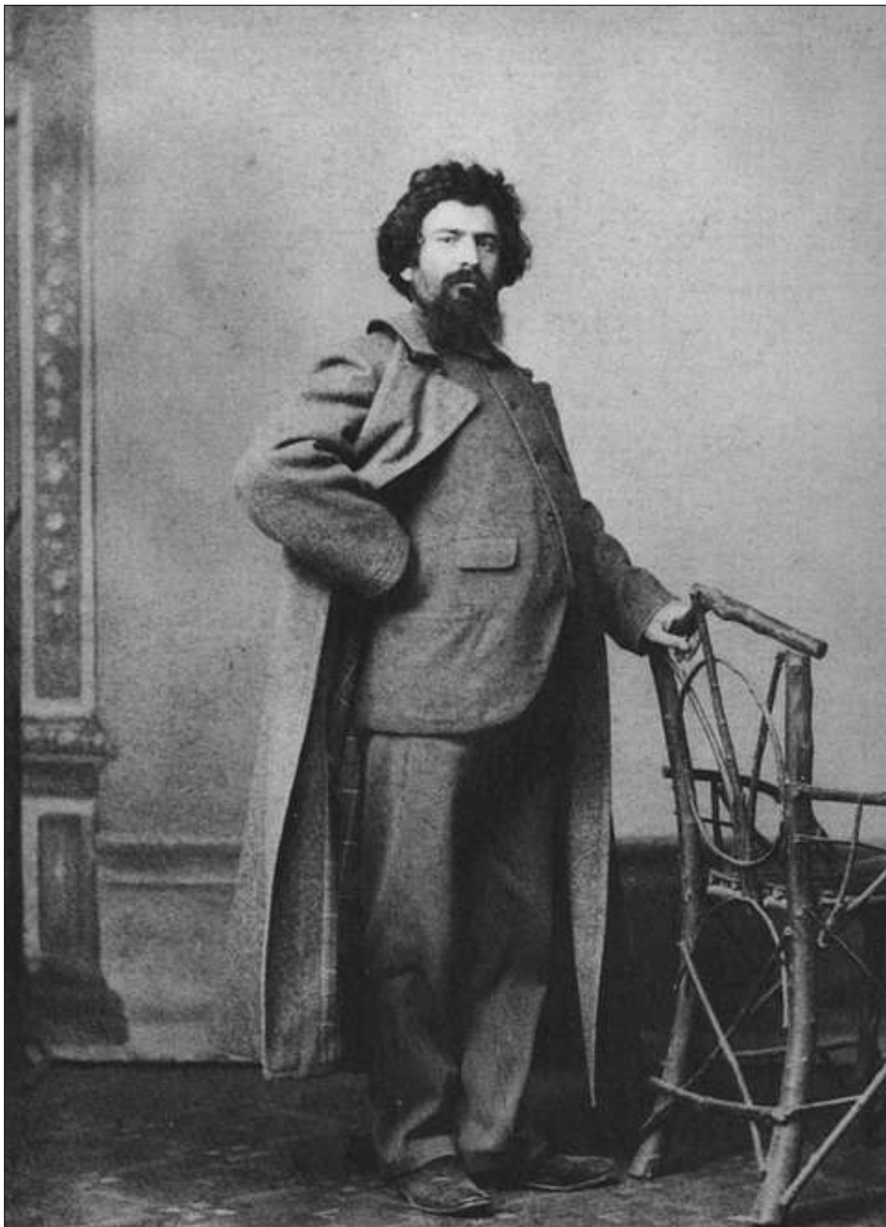
Giovanni Segantini – artist grischun da renum mundial.

Oz san ins ch'il bab Agostino, senza in rap en satg, è stà sfurzà a partir d'in