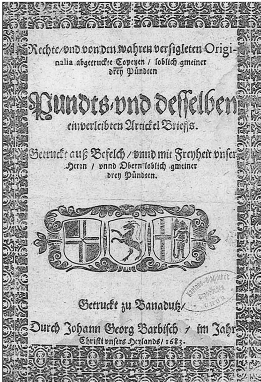
Versiu stampada da la Brev da federaziun dal 1524 e dals Artitgels da Glion. (Stamparia Barbisch, Bonaduz, 1683).

Ils emprims 18 Artitgels da Glion, stipulads ils 4 d'avrigl 1524, èn resor-