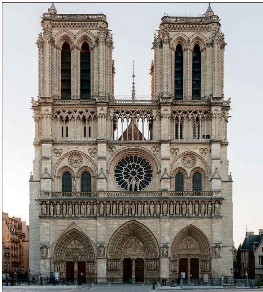
Laatedrala Notre-Dame de Paris duai puspè vegnir reconstruida e restaurada e puspè resplender en sia traglischur oriunda.