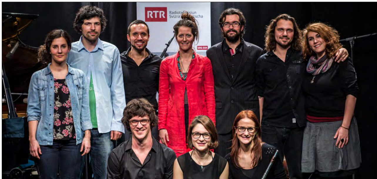
Ils participants dal concert final a Friburg, ils 29 da november 2014.