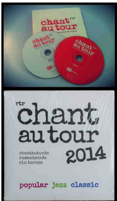
Cuvertas dals discs cumpacts.

La punt tranter generaziuns ed idioms han lura fatg las revistas da cover