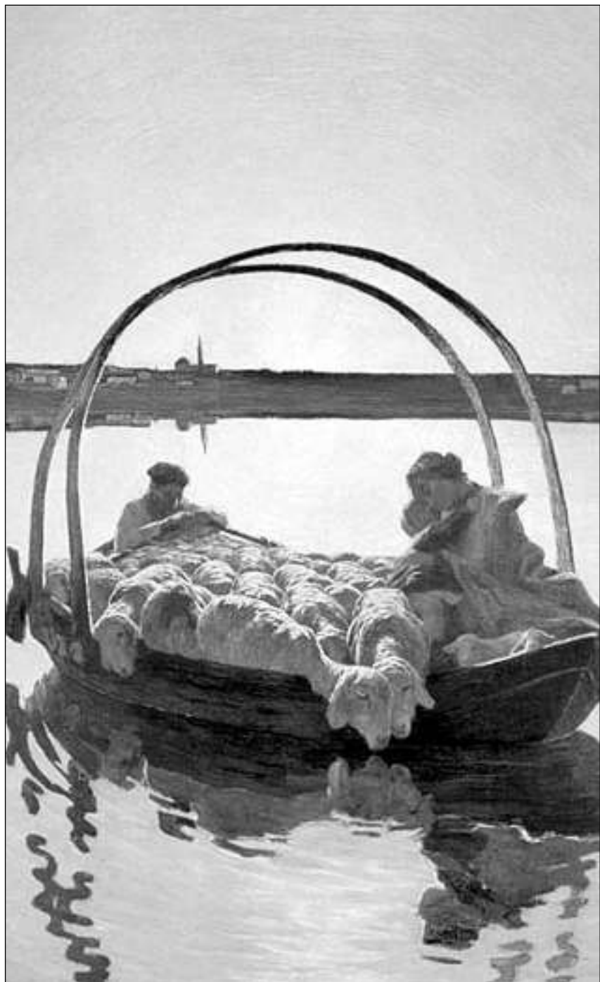
Segantini mida adina puspè ses maletgs existents. Era la pictura «Ave Maria» survegn ina segunda versiun.