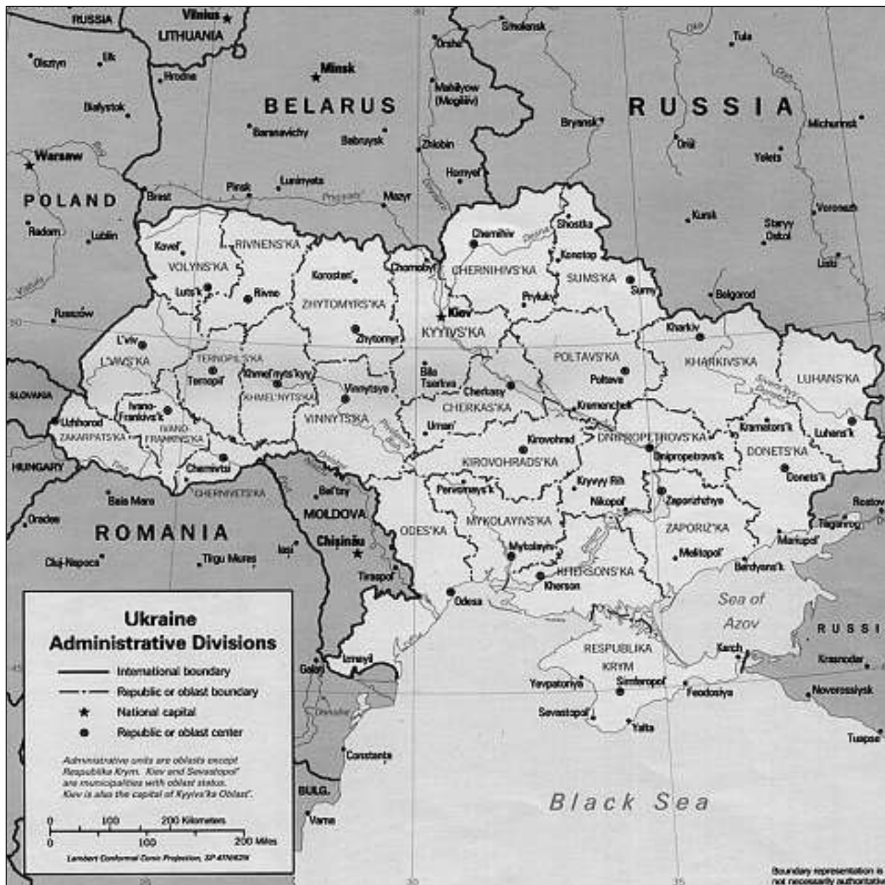
La Russia ha francà sia influenza en l'Ucraina sco gia en pliras anteriuras republicas sovieticas.

na dal vest cunter la guerriglia da la resistenza [antisovietica]» (4).