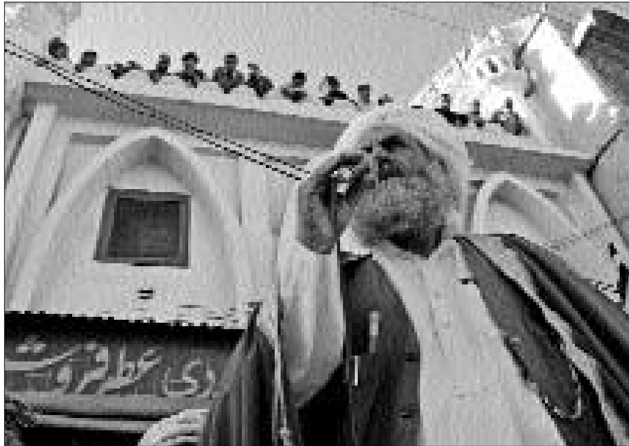
Davart bleras varts vegn pretais ch'ins pondereschia ina suspensiu dal fiu tar las attatgas militaras en l'Afganistan durant il ramadàn, il mais da curaisma da l'islam.

Il pled «islam», parent da «salàm» («pasch»), vul dir «suttamissiu voluntara [a Dieu]». Questa tenuta vegn punctuada dal Coràn, il cudesch sontg da l'islam; ses emprim chapitel, la «fatiha» («segl da la porta»), cun be set vers, tuna uschia: «En num da Dieu benefizient e plain misericordia, laud a Dieu, il signur da tuts munds! (...) El è il retg dal giuvenessendi. Tai adurainsa, Tai supplitgainsa d'ans gidar! Ans maina sin il trutg dal spendrament, il trutg da quels che Ti has sazià cun Tes benefizis, da quels che n'han betg merità Tia gritta ed han sa pertgirads da l'errur!» (p. 304). L'islam pretenda pia obedienscha, cunzunt areguard tschintg cumandaments fundamentals, ils