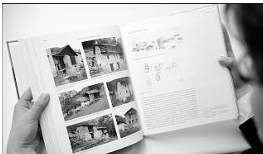
Il perscrutader bergiagliot ha publictà 2009 il cudesch «Facevano case».