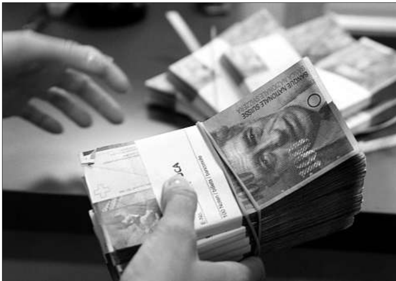
Mintga cusseglier u cussegliera federala ha ina paja da 440 000 francs ad onn.

Da quints da telefon, handy, fax ed internet na sto in cusseglier federal betg s'empatschar, tut quai vegn pajà da la