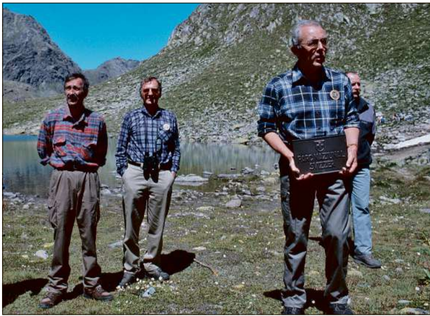
Martin Bundi e ses engaschament per natira ed ambient. La stad 2000 tar ils Lais da Macun. Sco president da la cumissiun federala dal Parc Naziunal Svizzer ha el pudì purtar si da l'Engiadina la tavla uffiziala en occasiun da l'engrondiment dal parc en quel territori da Macun. In term impurtant en l'istorgia dal Parc Naziunal Svizzer, in'istituziun che Martin Bundi ha presidià durant ils onns 1991 enfin 2000.