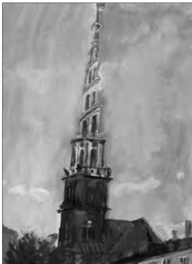
Clutger a Kopenhagen, 1934.