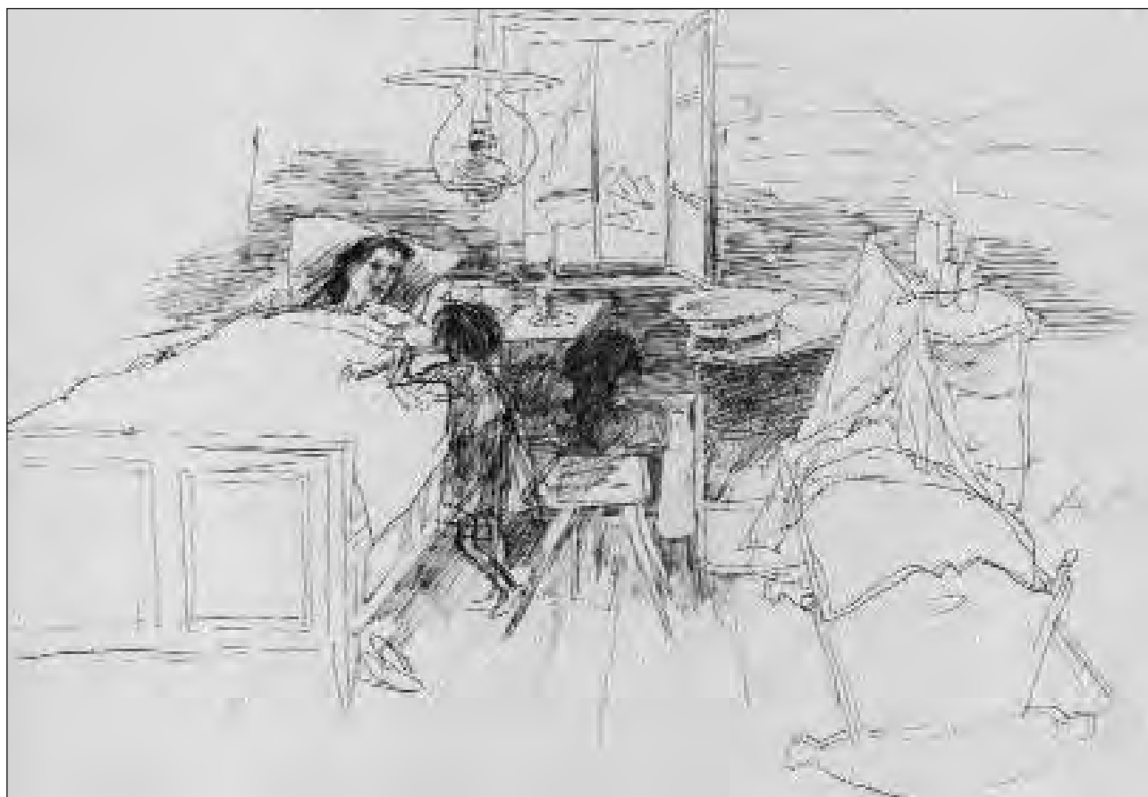
Chombra da durmir, 1947, tusch.