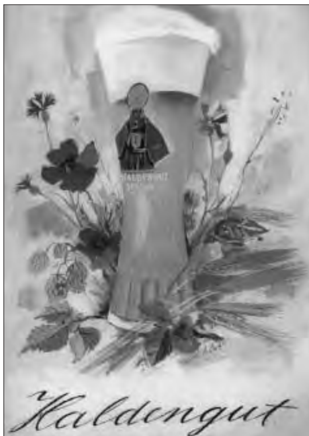
Haldengut spezial, 1940, maletg per in calender.