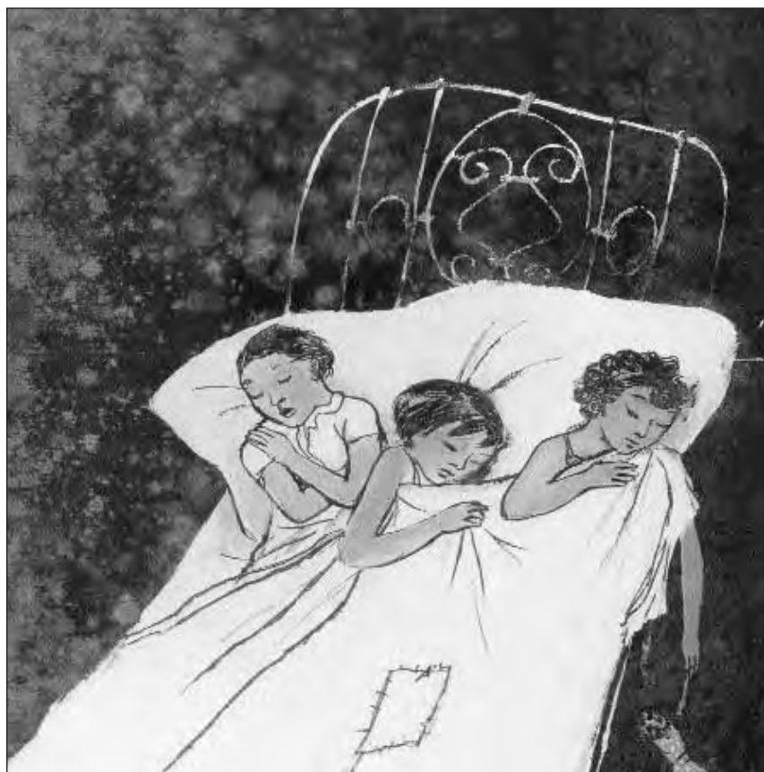
Sboz per in placat 1932/33

L'exposiziun è averta mardi fin dumengia, mingamai da las 10.00 fin las 17.00. La gievgia resta il museum avert fin las 20.00.