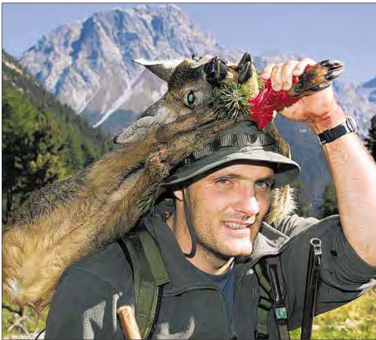
Temp da chatscha – per blers ils pli bels dis da l'onn.

La chatscha appartegna a la pli veglia ierta culturala ed era fermamain ritualisada e connectada cun la religiun (unfrendas da chatscha). Ils Romans veneravan Diana sco deessa da la chatscha. Il cristianissem ha supprimì la colliaziun religiosa da la chatscha. Tenor il dretg roman pudeva mintgin ir a chatscha libramain ordaifer ils areals privats. A partir dal temp autmedieval è la chatscha daventada il monopol dals signurs territorials en la Currezia. L'onn 1050 ha l'imperatur Heinrich III cedi a l'uvestg da Cuir il dretg exclusiv dad ir a chatscha da domaduas varts da Versomi e dal Rain oragiu fin a la sbuccada da la Landquart. La noblezza fascheva per regla diever dal privilegi da chatscha mo per tschertas spezias d'animals, oravant tut per il tschierv, pli darar per il chamutsch ed