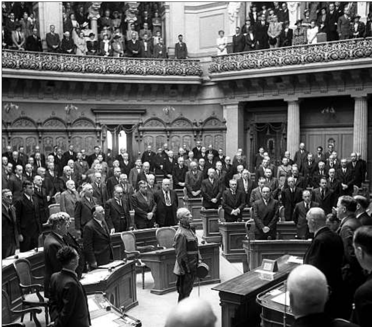
Saramentaziun da general Henri Guisan en l'assemblea federala.

En Svizra sto enconuscentamain mintga um prestar servetsch militar. Ed uschia absolva era Henri Guisan la scola da recruits. L'armada daventa dentant spert la segunda pitga dal pur Guisan. Pass per pass vegn el l'itinerant – da quel temp na stuev'ins betg