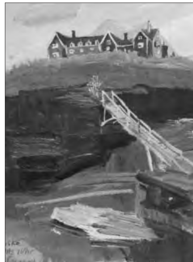
Abisko, Svezia, 1936.