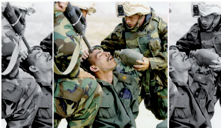
Il messadi tut tenor l'extract dal maletg: in schuldà irachais circundà da schuldads americans en la guerra da l'Irac 2003.

Fotografias da la pressa da boulevard mussan, co che redacziuns da maletg satisfan il plaschair