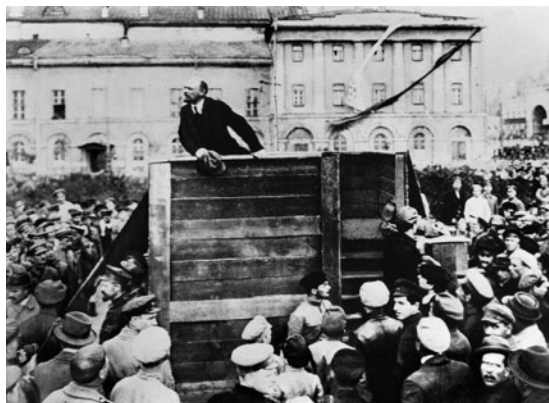
Carta postala cun fotografia originala da Lenin cun Kamenev e Trotzki sin la piazza da Swerdlow a Moscau. Pli tard èn Kemenev e Trotzki vegnids retuschads davent.