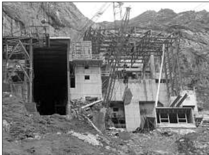
Tar il Muttsee e tar il Lai da Limmern na maina nagina via d'auto. Per transportar la rauba dovri ina pli gronda pendiculara: Qua la staziun Chalktrittli.

tads dal project, pertge i sa tracta d'ina ovra d'accumulaziun a pompa (Pumpspeicherkraftwerk). La Fundaziun svizra d'energia crititgescha che l'energia ord talas ovras saja energia idraulica tartagnada. I sa tracta en vardad mo pli d'energia atomara surdorada (veredelt). Duas intervistas mussan las posiziuns pro e contra ovras a pompa.