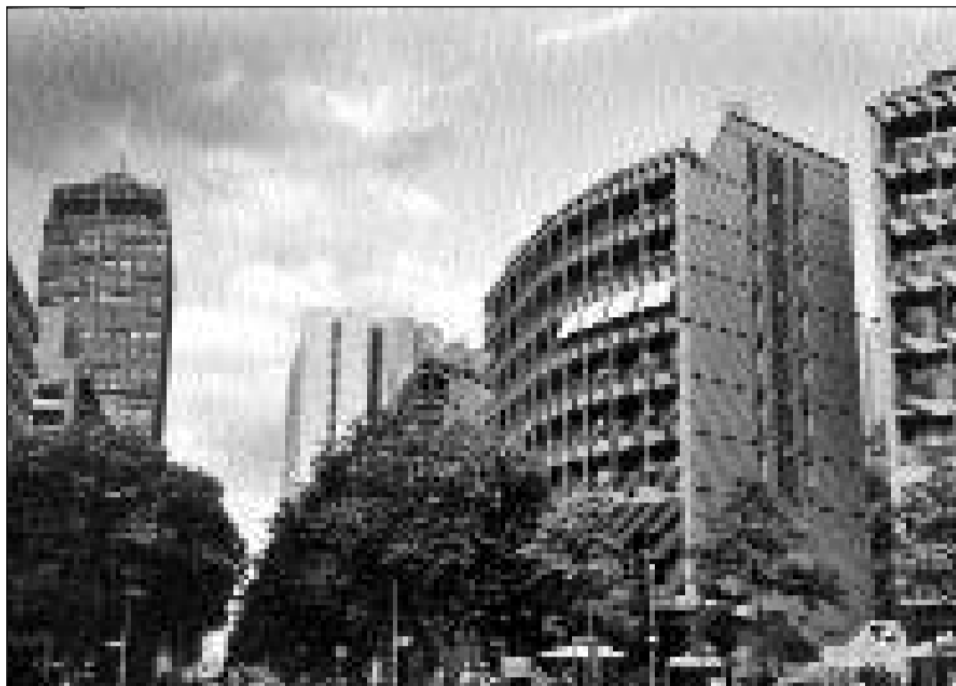
La nova fatscha da la veglia chapitala.