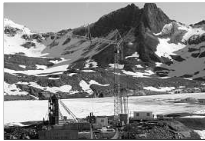
Il Muttsee è anc cuvert cun glatsch. Il lai vegn engrondi ils proxims onns uschia ch'il spivel d'aua è trenta meters pli aut.

La patruna da construcziun èn las Ovras Linth-Limmern ch'èn per 80 pertschient en possess da la NOK. Las investiziuns dad 1,8 milliardas francs portan la NOK e l'Axpo.