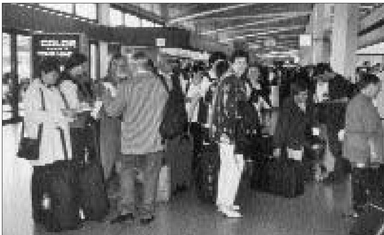
Adia Berlin – ed a revair!

Cura ch'ins va per ina curta dimora a Berlin – ina citad da radund 3,5 milliuns abitants e pir dapi 12 onns puspè reunida – ston ins metter ordavant prioritads. Senza in bus – a pè na pon ins betg cuntanscher bler – ed in bun guid local na fiss i gnanc pussaivel da guardar las pli impurtantas attraziuns