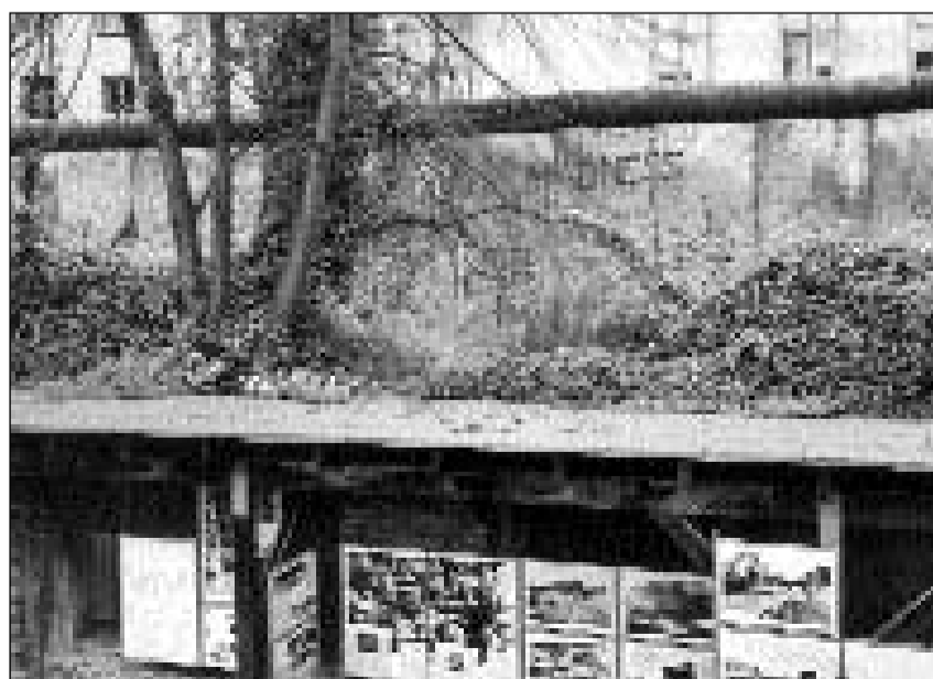
Rests da dus sistems terroristics. Su: restanzas dal mir da Berlin, sut: exposiziun davart la terror dals nazis en rests dals tschalers.