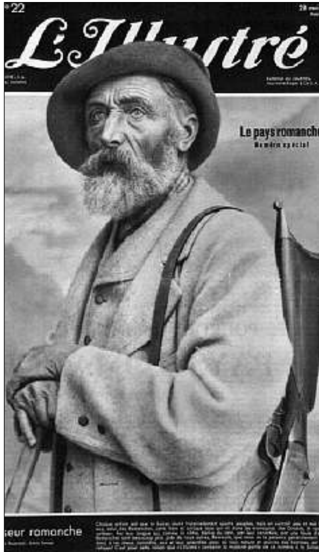
Tut las grondas gasettas svizras han rapportà antruras dal rumantsch.

Propi concretisà è il postulat vegnì pir en ils onns 1930. In impurtant promo-