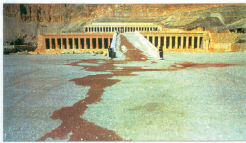
Blutspur des Grauens: Der Platz vor dem Tempel der Hatschepsut ist geräumt. Spuren des Massakers aber sind noch deutlich zu sehen.