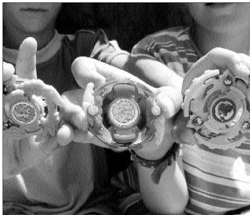
Beyblades: Els vegnan tratgs si cun ina corda. Il beyblade che rotescha il pli ditg gudogna.

Lura datti gea era tattas – per il solit ina funtauna fitg redeivla – e barbas u madritschas. Tuts quests parents fan guggent ina giada in plaschair ad in'uffant e