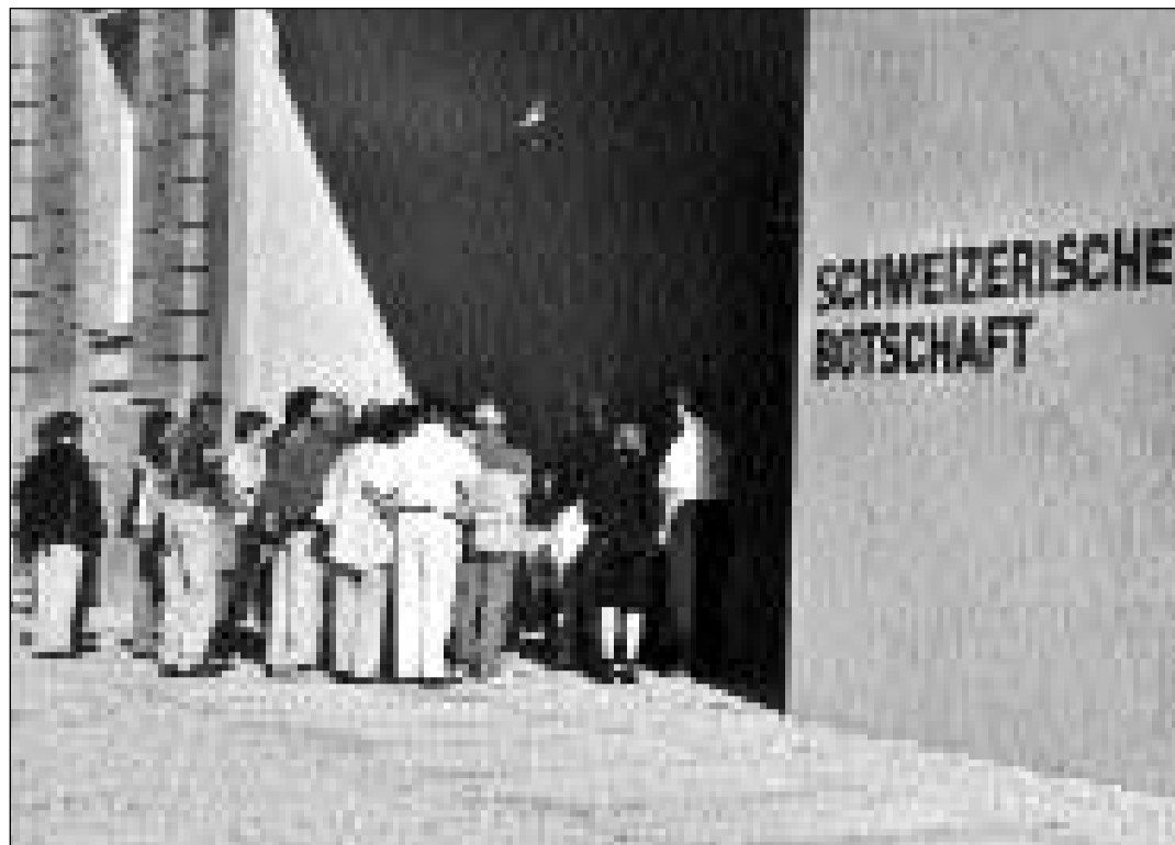
RumantschAs spetgan da pudair entrar en la nova ambassada e cumpran souvenirs.