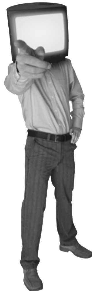
Lang Gyssi Knoll, Bern

rats da televisiun che pon recepir HDTV. En vendita èn pir moniturs plats preparads per HDTV (displays). La SRG SSR calquescha sco auters organisaturs da servetsch public cun ina introducziun pass per pass ed ina gestiun reglada a partir dal 2010. Per esser pronta registrescha la SRG SSR gia oz singulas emissiuns u gronds eveniments da sport en la qualitat da HDTV.