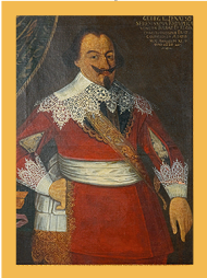
Portrait 7 1933