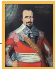
Portrait 9 1987