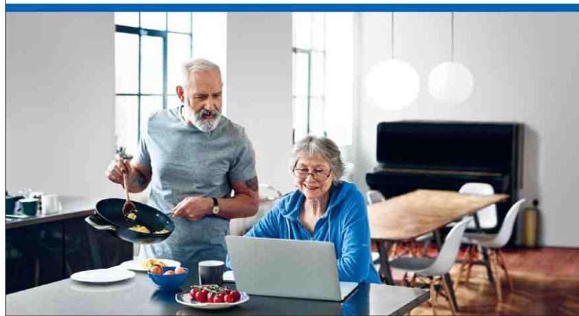
Infurmaziuns en tut las trais linguas chantunalas.

In program da la Lia grischuna cunter il cancer per incumbensa dal Chantun