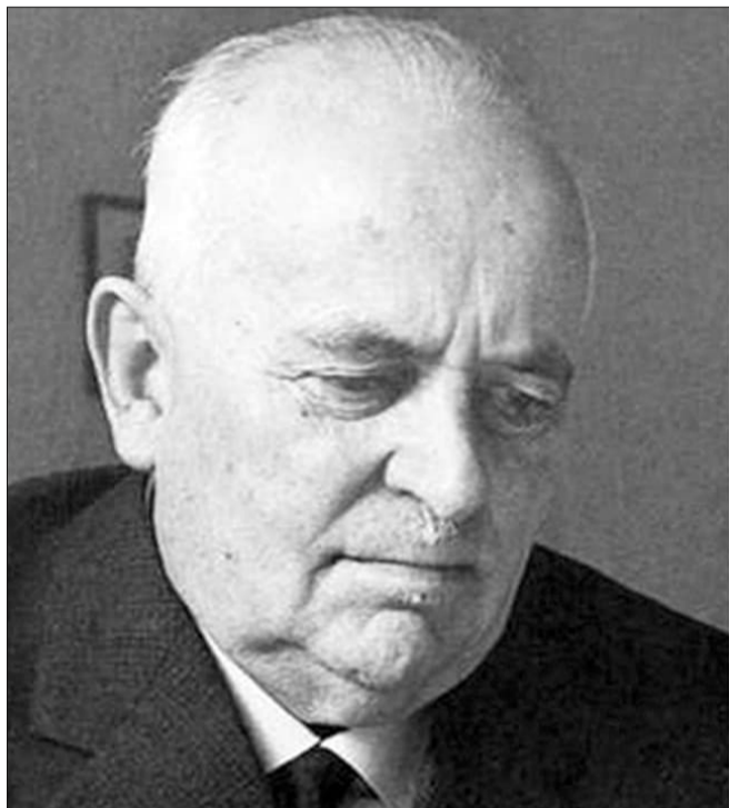
Ils participants dal concert final a Friburg, ils 29 da november 2014.

Ovra Cumponi passa 200 chanzuns per chor