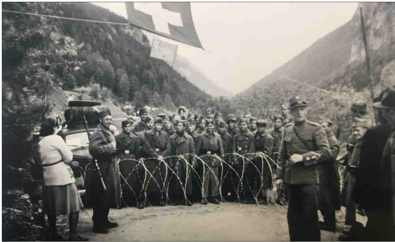
Vinadi, matg 1945: Fugia en Svizra curt avant la capitulaziun tudestga.

Quai è sa midà per intginas emnas vers la fin da guerra, cur ch'ils fugitivs arrivann si dal cunfin da Martina a Scuol. Ed ella relata, quant differenta che la fulla dals fugitivs era: «Igl èn arrivads vegls, mendus, pitschens uffants, igl èn vegnids schuldads, igl è arrivada ina dunna en las davosas emnas da la gravidanza cun in poppin sin bratsch, igl èn