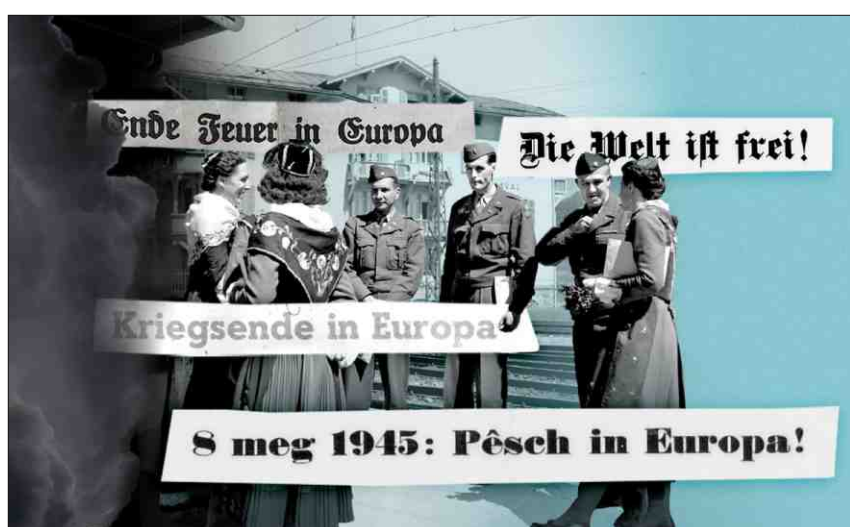
Schuldads americans en Engiadina – «Marella» dal matg 2020 che regorda als eveniments d'avant 75 onns.