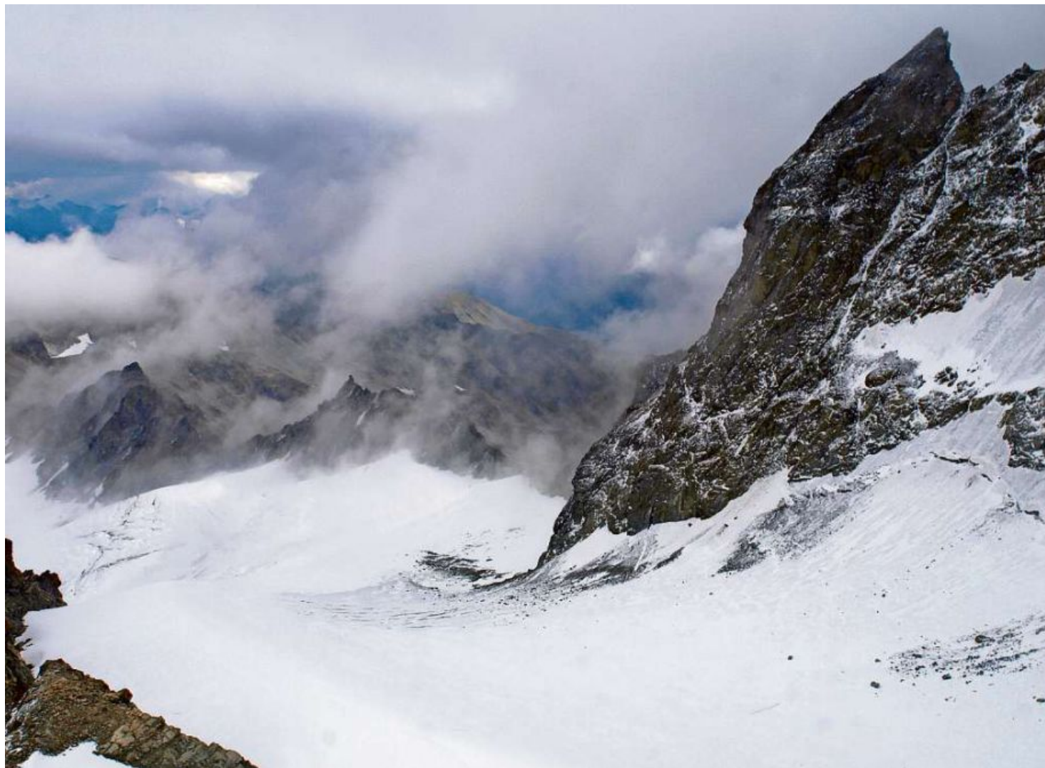
Il maletg da brenta e nivlas da l'ascenziun sin il Piz Kesch.