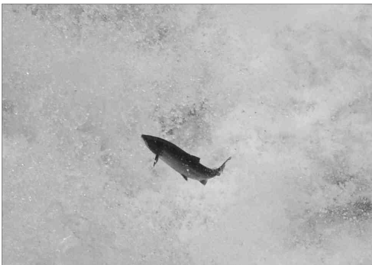
Scarun che sa mova d'ina cascada siador.