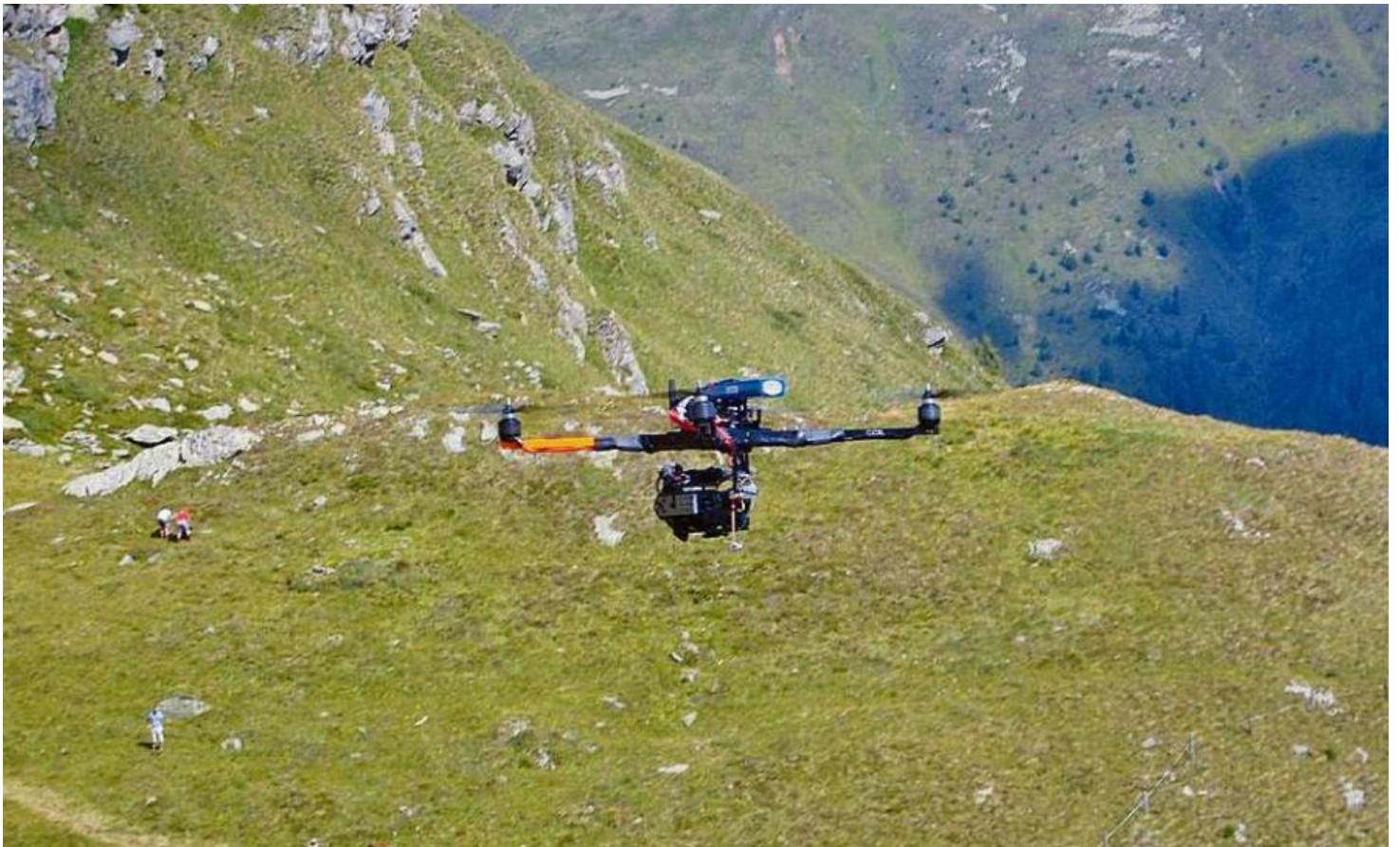
Mo en Svizra sgulan gia passa 100000 dronas per il tschiel enturn.