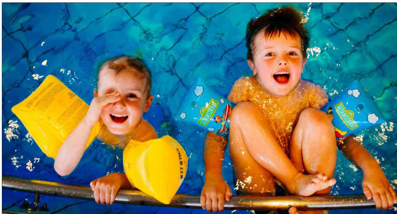
L'uffanza – scuvrir e conquistar il mund giugond.

Pli baid fascheva il cussegl magari in la giada l'onn ina visita en stanza da scola, tscherniva la magistraglia e controllava ch'els uffants sajan a chasa, cur ch'il zain da notg tutga. Ozendi è la paletta d'in-