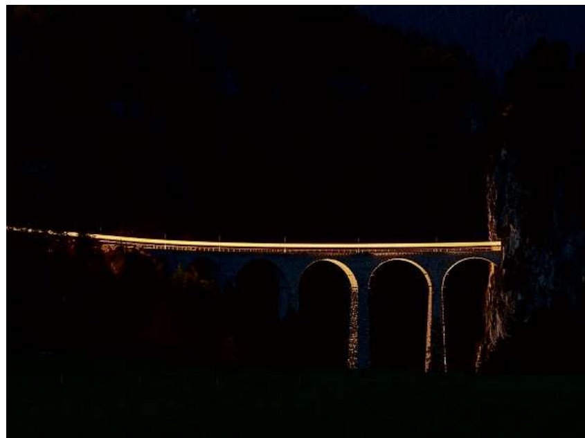
In onn pli «stgir» en l'istorgia da la Viafier retica. Ella sto scriver dal 2020 in deficit da var 7 milliuns francs.

Sa reduci marcantamain per 22% resp. per 24% è er il transport d'autos tras il Veraina. Er las interpresas affiliadas da