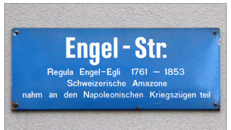
Via a Turitg che regorda a Regula Engel-Egli.

Il december 1804 è Napoleun Bonaparte sa curunà en preschientscha dal papa sco imperatur dals Franzos. Vinzens de Salis-Sils, aristocrat grischun e member da la delegaziun svizra da gratulants, raquinta da ses segiurn a Paris, da las scuntradas cun Napoleun e ses ministers e da la curunaziun pompusa en la catedrala