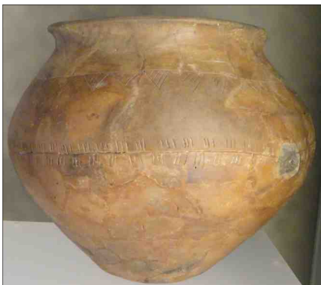
Exempel d'in vasch ch'è vegnì a la glisch a Cazas-Cresta.