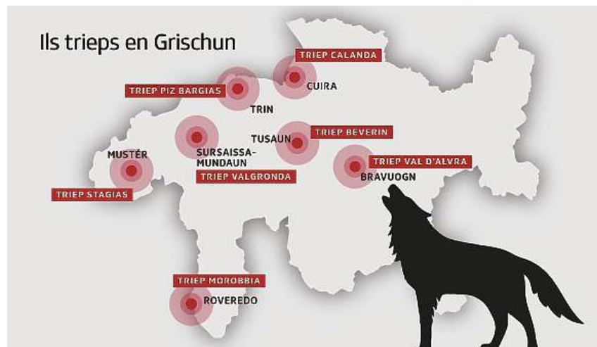
Ils trieps da lufs en il Grischun.