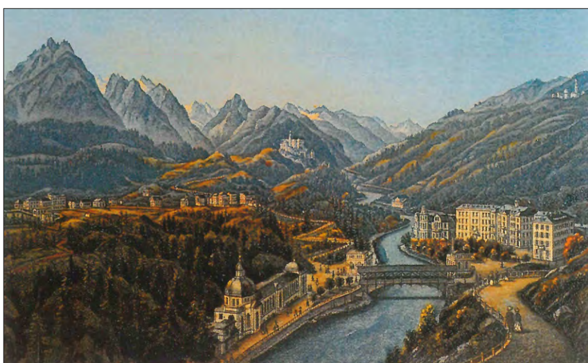
Vista cumplessiva dals stabiliments da cura da bogn a Tarasp (ca. 1880).