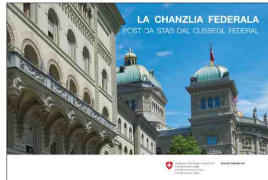
Brochuras rumantschas che infurmeschan davart la lavur da la Chanzlia federala, 2012 (survart) e 2016 (a sanestra).

Management da sesidas dal Cussegl federal: Il Cussegl federal salva tranter 40 e 60 sesidas per onn. Durant las var 100 uras da sesida vegnan tractadas mintga onn circa 2500 fatschentas. Per la sesida emnila vegnan sutmessas en media 50 fatschentas a la deliberaziun tras il Cussegl federal.