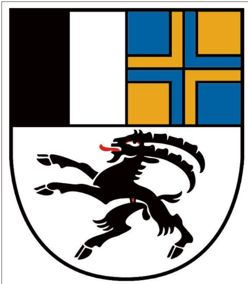
La vopna uffiziala sco ch'ella sa preschenta dapi il 1932.

Vopna: Il capricorn è l'ensaina da la Lia da la Chadé. In'emprima represchentaziun en la catedrala da Cuir deriva da l'onn 1252. Sco animal da vopna cumpara il capricorn l'emprima giada sin in document dal 1291 e sin ils sigils dals uvestgs Johannes I Pfefferhard enturn l'onn 1325 ed Ulrich V Ribl enturn l'onn 1331 (capricorn nair rampignant sin