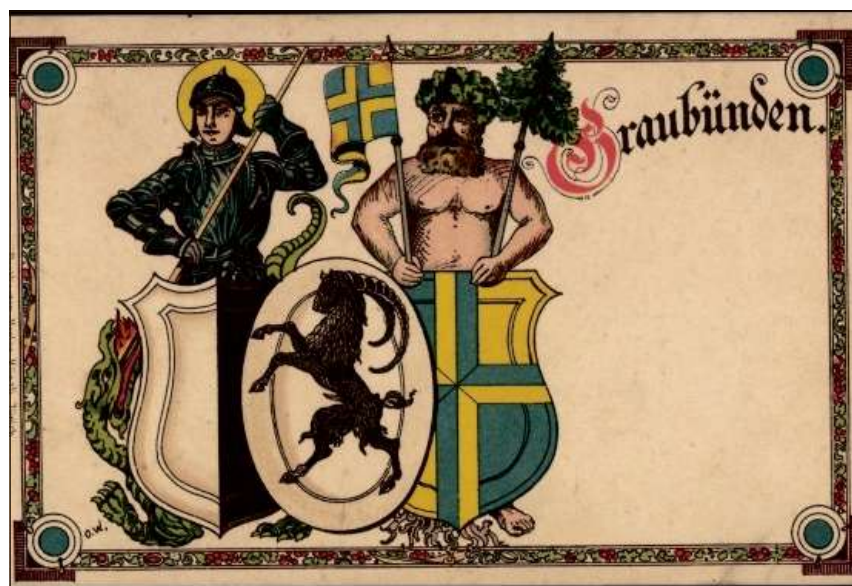
Carta postala cun la vopna chantunala en sia furma veglia.