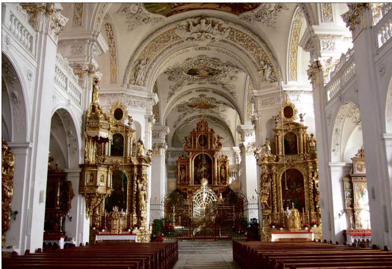
Intern da la baselgia claustrala.

En tutta cas ha avat Adalbert cumenzà a demolir l'onn 1683 ils vegls edifizis dal convent, malgrà che la situaziun finanziaria era vinavant manglusa. Il me-