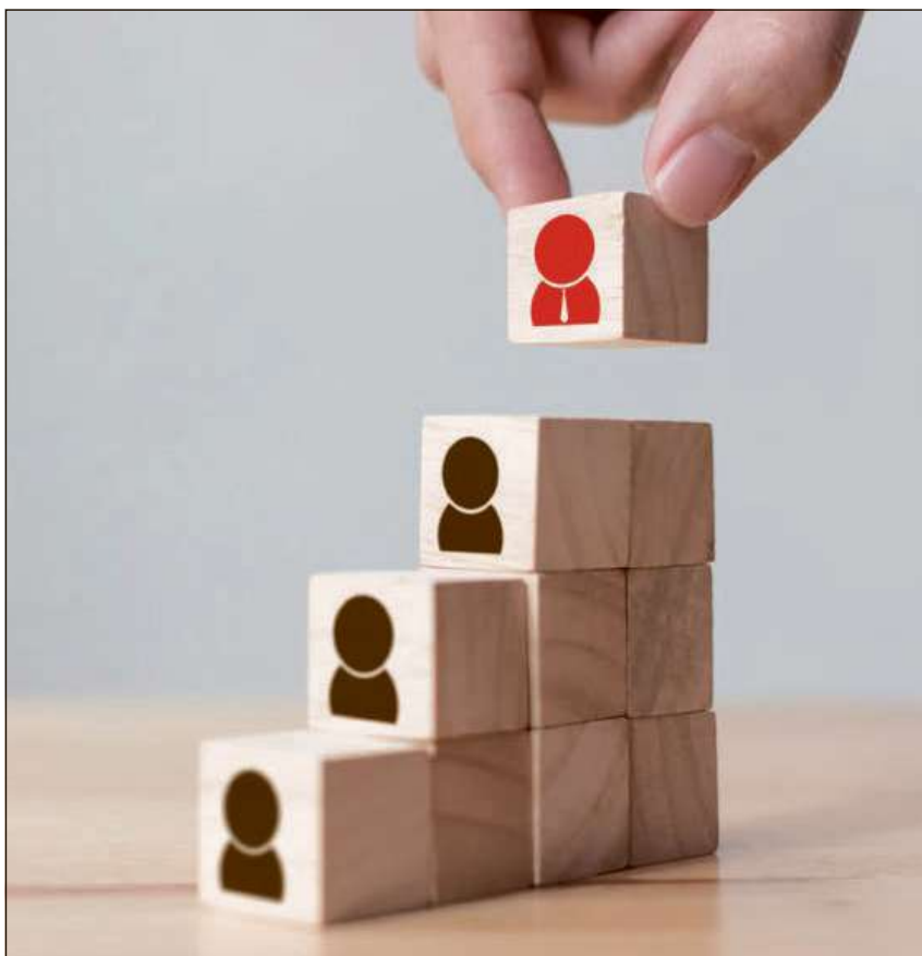
Ierarchia e cultura determineschan essenzialmain il svilup d'in'interpresa.

Il svilup dal persunal cumpiglia però era ristgs. La fluctuaziun dals collavurats po crescher sin fundament da la situaziun sin il martgà da lavur. Sch'i mancan las pussaivladads internas d'applitgar las qualifitgaziuns acquistadas demotivescha quai ils employiads. En pli demotiveschi il persunal sche singuls collavurats na vegnan betg resguardads en il rom da las mesiras da svilup ubain en moda fitg dif-ferenta. Ultra da quai èsi da princip grev da quantifitgar il success da talas mesiras.