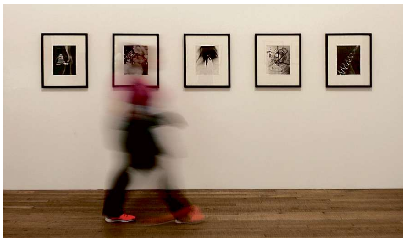
Art, ma er istorgia, natira ed auter pli – ils museums cuvran in vast spectrum d'interess.

Per mintga museum preschenta il portal www.museums-grischuns.ch cun texts e cun maletgs ils puncts central e las particularitads da sia collecziun. Cunquai vegn purschida a las visitadras ed als visitaders potenzials da la Svizra e da l'exteriur ina survista davart las singulas chasas, e quai a moda cumplessiva e compacta. Medemamain publicadas èn infurmaziuns generalas per visitadras e visitaders (adressa, uras d'avertura, pretschs d'entrada) ed actualitads. Ultra da las instituziuns gia etablidadas duain er vegnir pre-