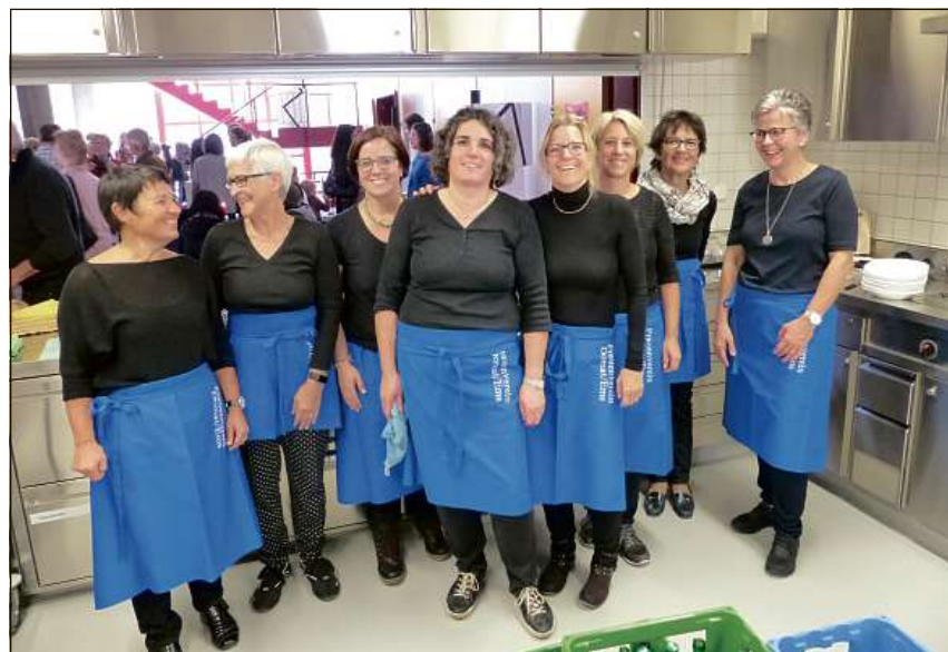
Il team en cuschina ha procurà per il bainstar dals blers preschaints.