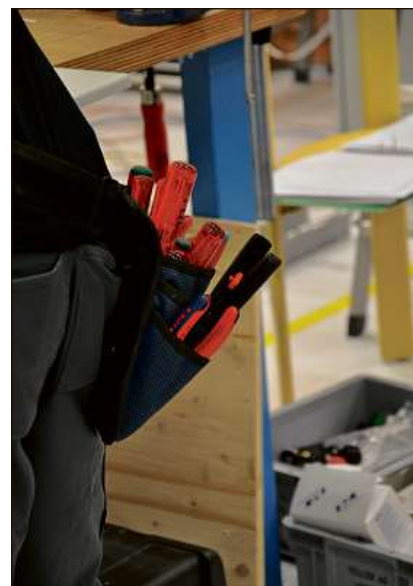
Tirastruvas, zangas, rispli e lingiala dovran ils electroinstallaturs als campinadis – ma cunzunt era buna gnerva.