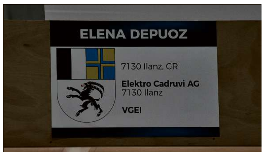
Ina buna referenza: Per las fatschentas che tramettan in participant èsi er in pau reclama.