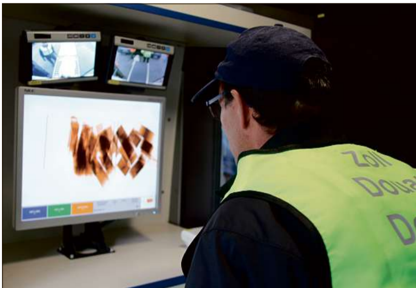
Radiografar ha la controlla er cumpiglia.