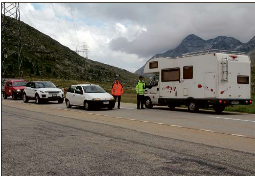
La controlla gronda ha gi lieu al Pass dal Bernina.