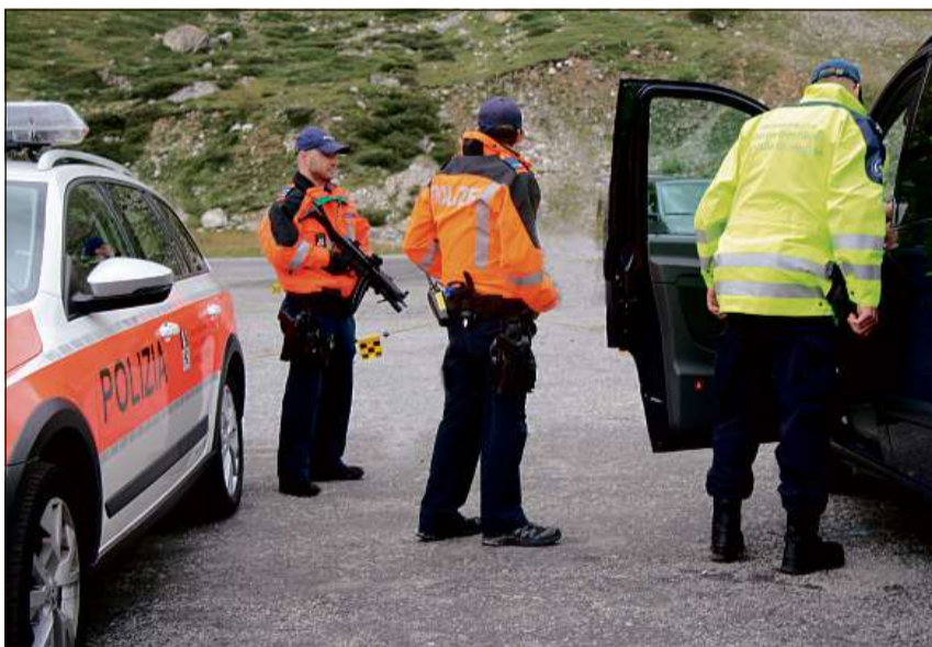
Cuminaivel en acziun: polizia e guardia da cunfin.