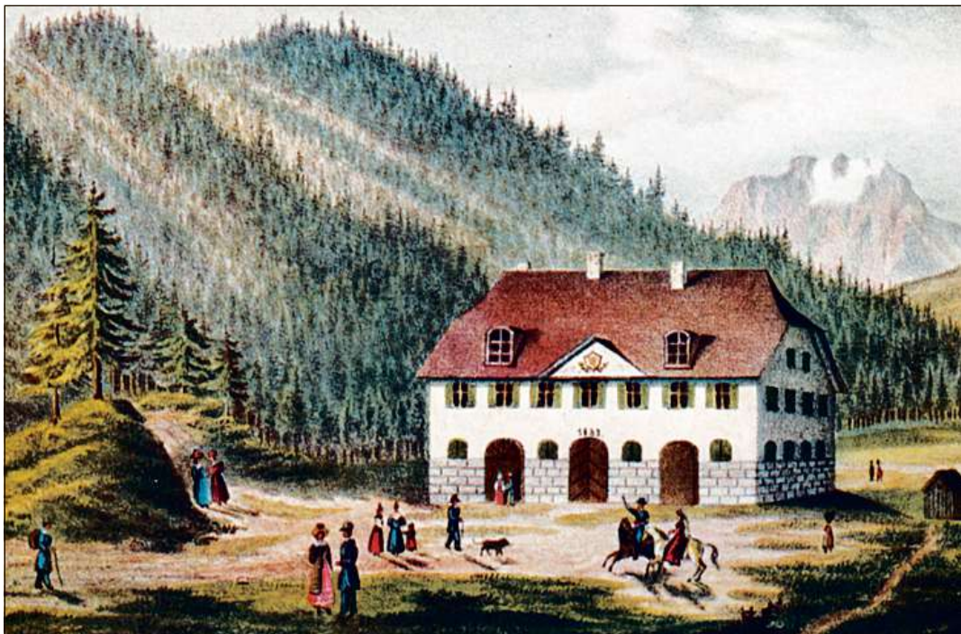
L'emprima chasa da cura sper la funtauna da Mauritius, eregida 1832.