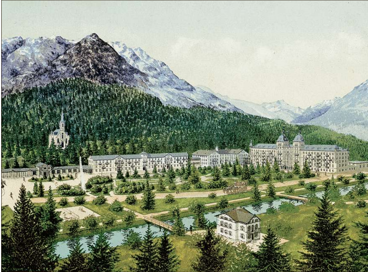
Il magnific stabiliment da bogn vers la fin dal 19avel tschientaner – in Versailles da las Alps.