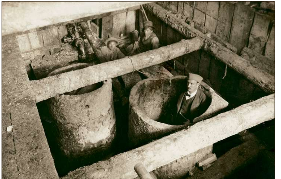
L'emprima tschiffada d'aua datescha da 1411 e dastgass esser la pli veglia construcziun da lain da l'Europa.