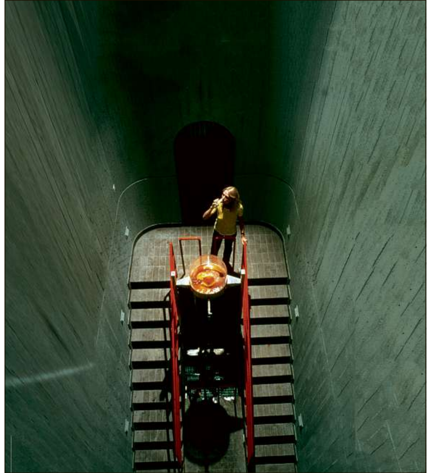
Actualmain sa chatta la pli veglia e renumada funtauna d'aua curativa en in stan desolat. Oz vegn ella zuppentada a la publicitad.