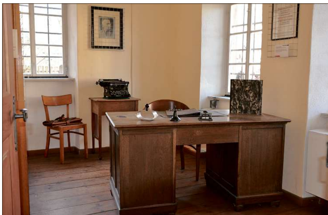
Il tipic uffizi d'antruras.