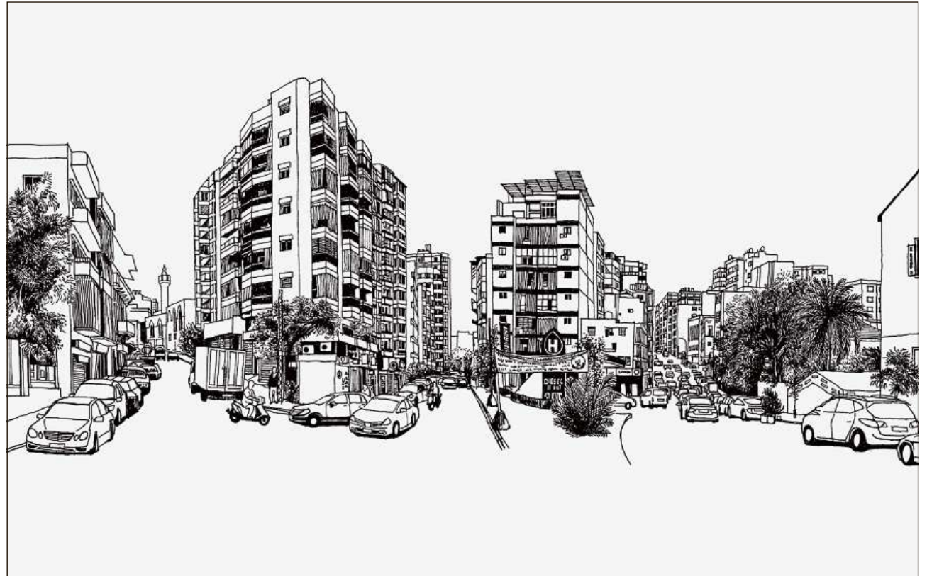
Dissegn reproducì ed engrondi, Beirut.

Ultra dals exponats cumparan duas publicaziuns: in catalog d'exposiziun biling (rum./tud.) ed ina collecziun da citats rumantschs che documenteschan tut il pussaivel e nunpussaivel dal mund dals bustabs, dal Libanon sco era da la Rumantschia – novitads, discurs, slo-