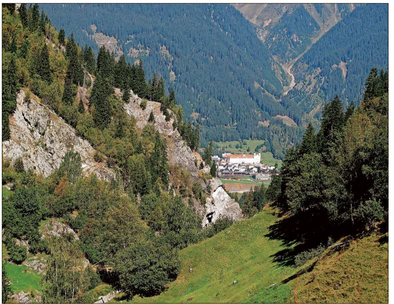
Ils abitants da la Cadi (Casa Dei = Chasa da Dieu) eran subdits da la claustra da Mustér.

Ils subdits da l'uestg da Cuira han existì oravant tut là, nua che l'uestg exequiva la suveranità territoriala e la giurisdicziun, per exempel en la Tumleasta ed en l'Engiadin'Ota. Ils subdits ecclesiastics da tals dominis cumpigliavan ils libers, ils nobels ed ils ministerials, plinavant ils libers dal terz stan (libers per semper, quadraris e quartanis), ils colons ed il servs. Subdits ecclesiastics devi ultra da quai era là nua ch'in signur feudal