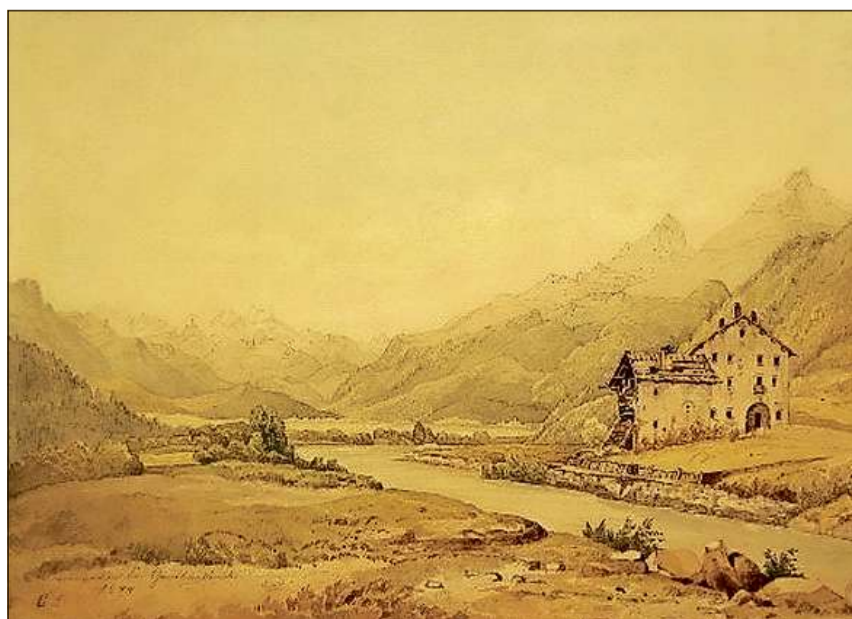
Sco territori sutta mess a l'uestg da Cuira è l'Engiadin'Ota ida politicamain sur lung temp in'otra via che l'Engiadina Bassa.

L'organisaziun politica en il territori grischun era caracterisada da principi tras in urden feudal, betg auter ch'en tut la societad europeica da quel temp. Purtaders nobels da dominis seculars ed ecclesiastics exercitavan la pussanza e la suveranità sur ina puraglia pli u main dependenta. Ils urdens feudals e las furmas da la pratica signurila correladas eran sutta messas a fermes midaments. La suveranità territoriala e la chastellania furmavan ils fundamenti per mintga domini aristocratic autmedieval. Omaduas furmas da domini han subì en il temp medieval tardiv ina midada decisiva. Il domini feudal, che colliava en il temp autmedieval il dretg da disponer da terren utilisabel, unì inseparablmain cun ils dretgs (giudizials e.a.) sur da persunas residentas sin quel, è alura sa dividi en differents champs, en ils quals ils dretgs funsils, giudizials e da persuna èn sa svilupads mintgamai a moda autonoma. Ils dretgs da terren e fund èn vegnids objectivads en il temp medieval tardiv e transformads en rentas impersonals, pajadas en daners e martgadadas libramain. Il declin economic, mortoris durant guerras e l'extincziun da dinastias han provocà ina viva fluctuaziun en il patriziat. Mo excepziunmain pudevan famiglias mantegnair lur status per pliras generaziuns. Adolf Collenberg