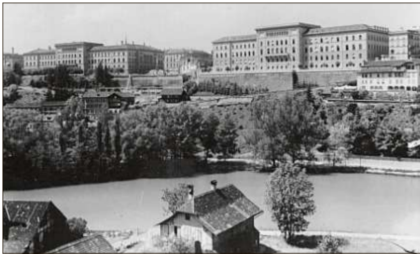
Las Chasas federalas ost e vest (1896).

Precis tuttina simpel sa preschenta l'interior. Sulettamain per la sala centrala ed ils locals da vart dal sid situads a l'emprim plaun fan ins investiziuns pli grondas – la finala en questas localitads resalvadas al Cussegl federal. Il fundament bletsch sa mussa bain sco problematic. Ins po però tuttina exequir speditivamain las lavurs e surdar l'edifiziu la stad 1857 al Cussegl federal. Ils 5 da fanadur 1858 sa raduna per l'emprima giada l'Assamblea federala en la nova sala dal Cussegl nazional. Per reguardar il Parlament federal a sia gronda prestaziun construescha la citad en la curt