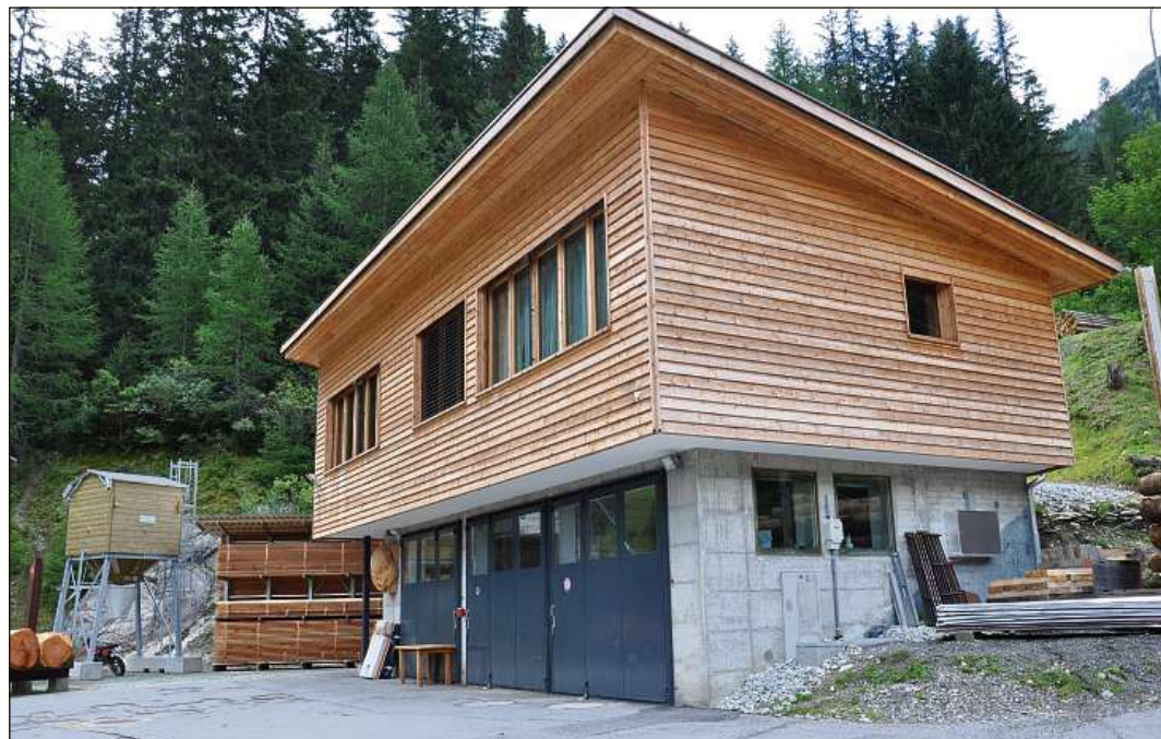
Daivets na sto Farera betg far per bajegià quest nov lavuratori.