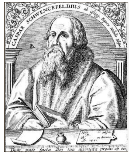
Sper anabaptists èn stads activs en il Grischun sacramentars, vul dir aderents dal spiritualissem refurmatoric da Kaspar Schwenckfeld.

La gronda affluenza da fugitivs religius talians, persequitads da l'Inquisiziun romana, e las activitads dals anabaptists e