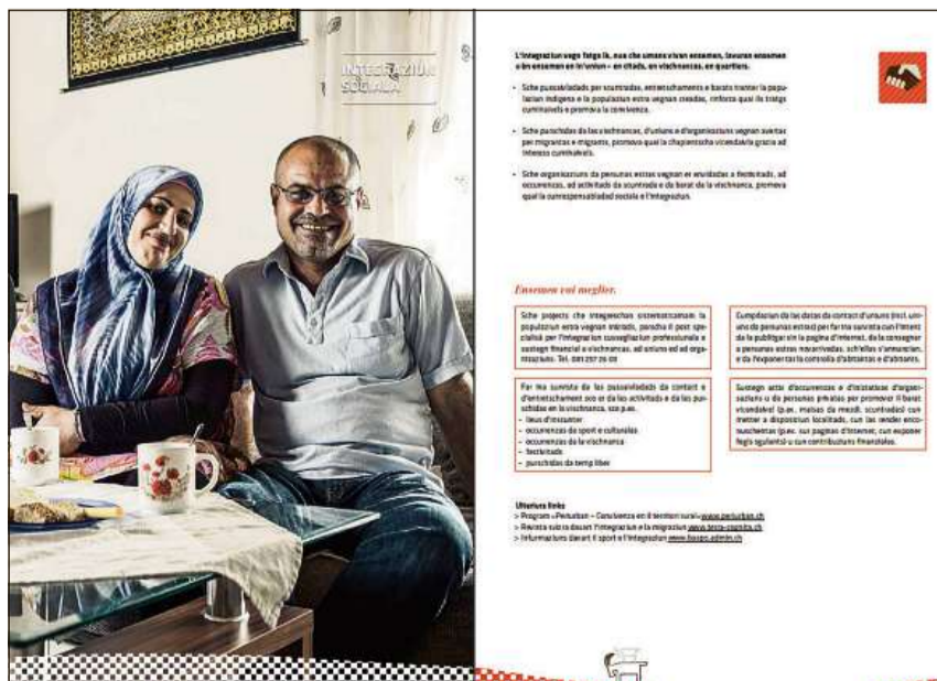
Sguard a l'intern.