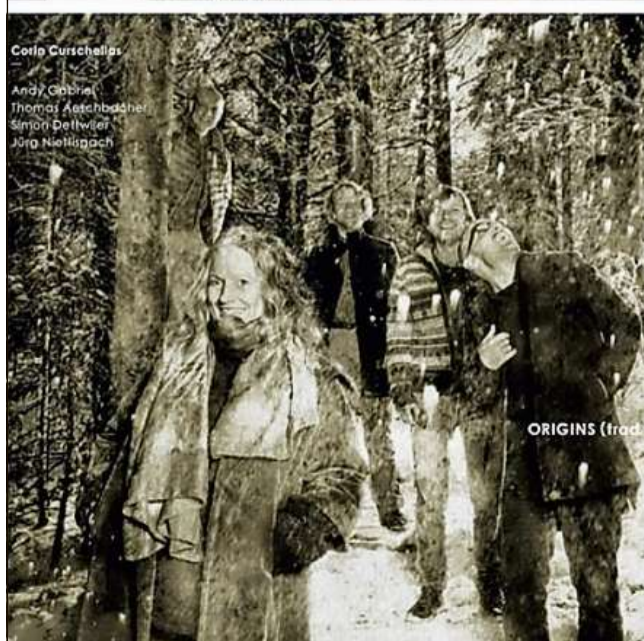
Ils dus discs en la versiun cumpari- da tar R-tunes.