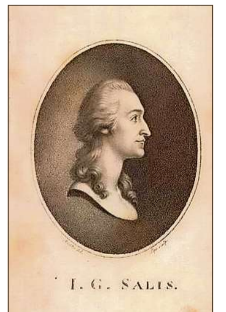
Busta dal poet Johann Gaudenz von Salis-Seewis (1762–1834) ch'ha er fatg carriera militara e politica.