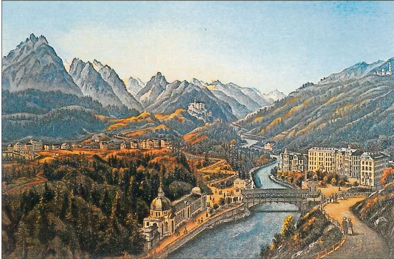
Infrastructura turistica a Tarasp-Vulpera (ca. 1880).

L'agricultura e la selvicultura han represententà fin il 1920, per quai che regarda il dumber dals occupads, las branschas economicas las pli impurtantas dal Grischun. En consequenza da meglras cundiziuns dal martgà ha l'allevament da muvel surpassà a partir dal 19avel tschientaner plaunsieu la cultivaziun d'advers. Il dumber da nursas e da chauras è sa diminui. Il chaschiel magher produci sin las alps era destinà a l'agen consum, insatge chaschiel grass e paintg eran reservads a la vendita. A partir dal 19avel tschientaner è vegnida installada chaschiaras (cooperativas) en vischnancas. Cumbain ch'ils imports da graun han adina puspè interrut l'autarchia economica, era l'economia da subsistenza enturn il 1800 probablamain anc predominanta. La pli gronda part da las entradas derivava da la vendita da biestga. Anc en il 19avel tschientaner era il commerzi da barat fermamain derasà (per exempel graun per friga). Crudadas dals pretschs han provocà veritablas crisis agraras en l'allevament da muvel, uschia en la segunda mesadad dal 19avel tschientaner e surtut en il tranterguerras (1919–39), durant il qual blers manaschis èn s'indebitads fermamain. La Constituziun chantunala dal 1880 postulava explicitamain la promoziun da l'agricultura, per exempel tras premiaziuns da muvel bovin e meglieraziuns. Cooperativas e societads fundadas per l'allevament, la produziun, il consum e la finanziaziun han