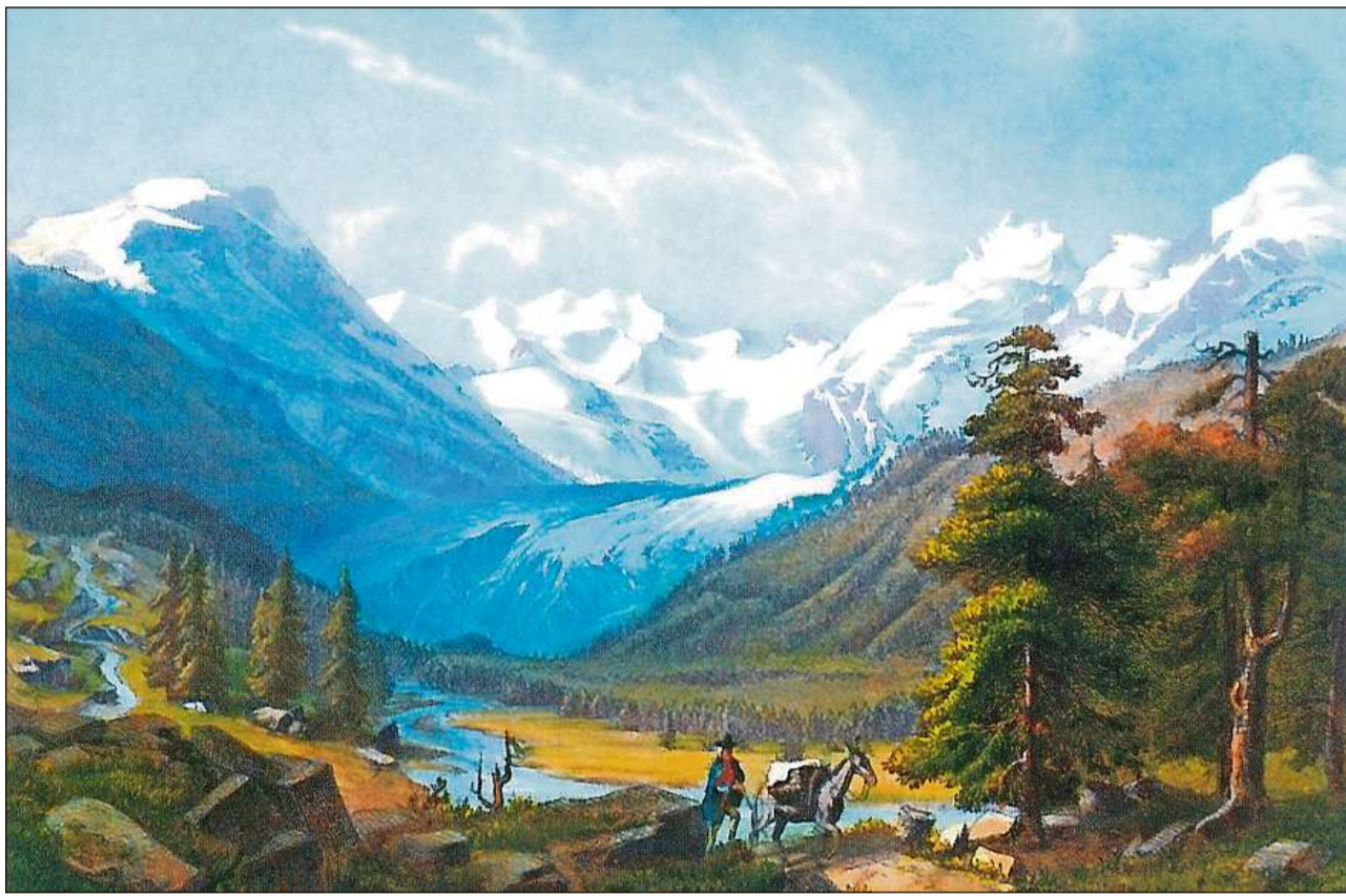
Via da sauma sur il Pass dal Bernina.

L'economia retica dal 6avel fin il 15avel tschientaner cumpigliava ils quatter suandants secturs principals: l'agricultura, l'exploitaziun da materias primas, ils products da mastergnanza, il traffic da martganzia