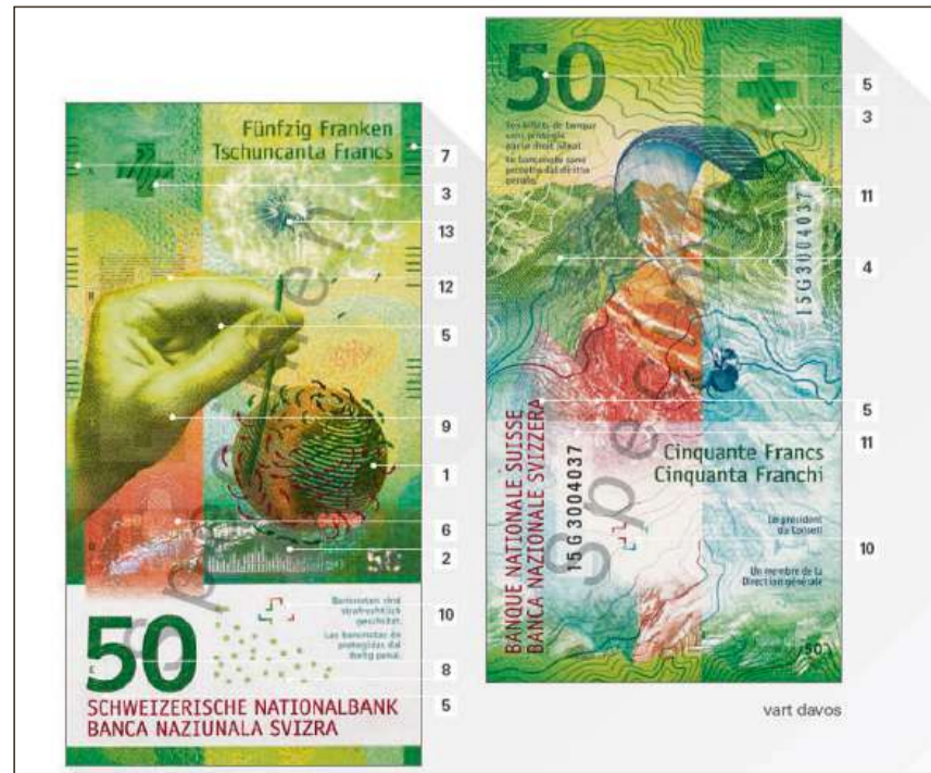
Las differentas caracteristicas da segirezza.

La preschentaziun: Dossier «Bancnotas svizras». Dapli infurmaziuns: chatta.ch/?hiid=225 www.chatta.ch