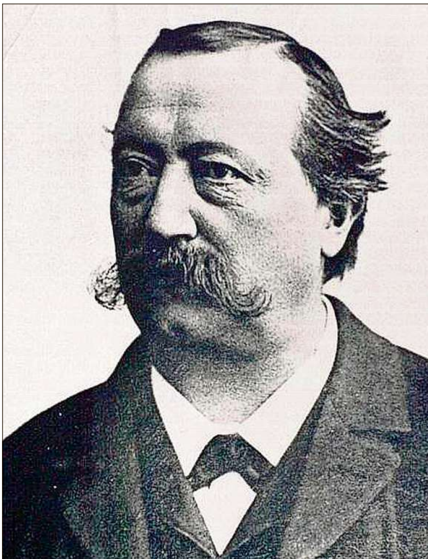
Giacun Hasper Muoth (1844–1906).