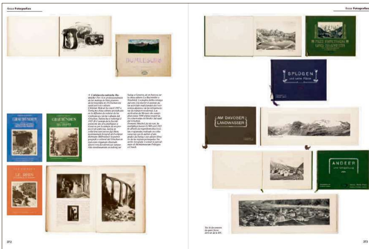
Focus tematic «fotografias» cuntegni en la versiun stampada dal LIR.