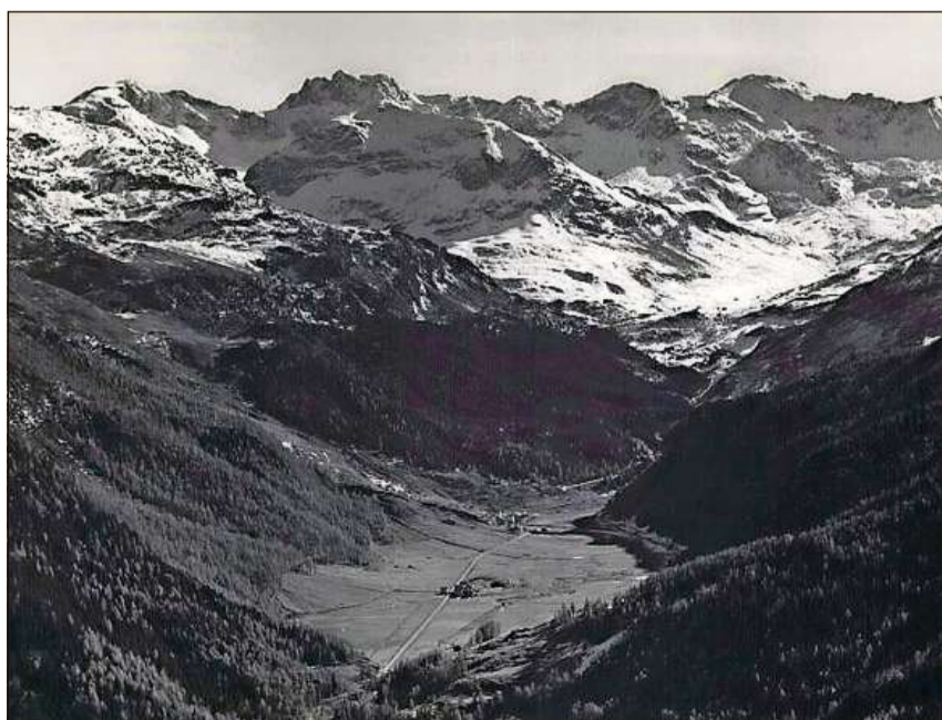
La planira da Murmarera è svanida il 1954 en il lai da fermada.

Dapli infurmaziuns: chatta.ch/?hiid=2314 www.chatta.ch