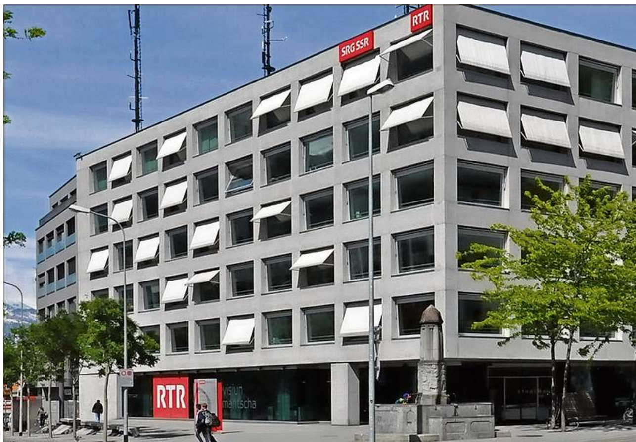
Il 2006 è vegnida inaugurada la nova Chasa RTR che unescha radio e televisiun sut in tetg.