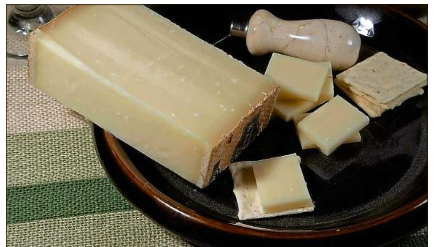
Il gruyère – chaschiel famus dapi tschientaners.

Tar il pled «Bénichon» (u «Chilbi» per quels da lingua tudestga) pensa mintga Friburgaisa e mintga Friburgais en emprima lingia ad in grondius past festiv, ad ina veritabla gastaria, tar la quala ins po giu'dair tut las spezijs da charm d'in bain puril: bov, portg, agnè, preparadas en diffè-